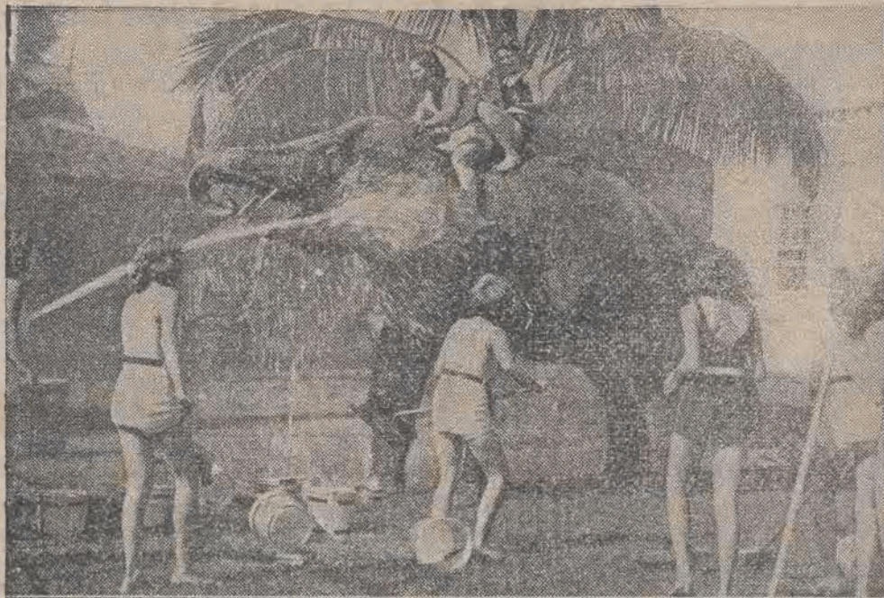
a na południu, w Miami Beach, pod palącymi promieniami słońca, ludzie używają lata, zabawiając się wesoło na plaży.