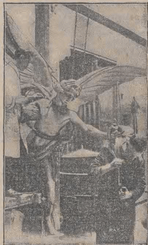
Znana statua Erosa, zdobiąca najbardziej ożywiony punkt Londynu Picadilly Circus, która niedawno znikła na dłuższy czas, powróciła przed kilku dniami na swoje miejsce. Przyczyną tego zniknięcia było uszkodzenie statui przez pijanego przechodnia, który w nocy Sylwestrowej wdrapał się na głowę posągu skąd został ściągnięty przez policjanta. W czasie wynikłej z tego powodu bójki statua Erosa została silnie uszkodzona i musiała być poddana reparacji.