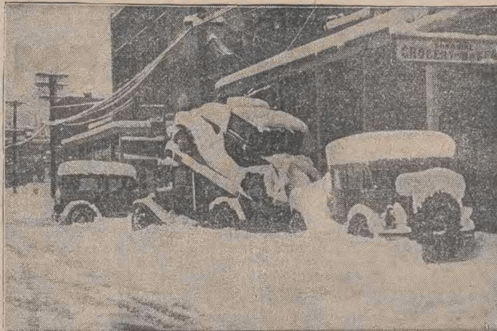
Stany Zjednoczone zajmują tak olbrzymią przestrzeń, iż nawet pod względem pogód stanowią typowy kraj kontrastów. Na zachodzie kraju, miasta pokryte są grubym całunem śnieżnym,