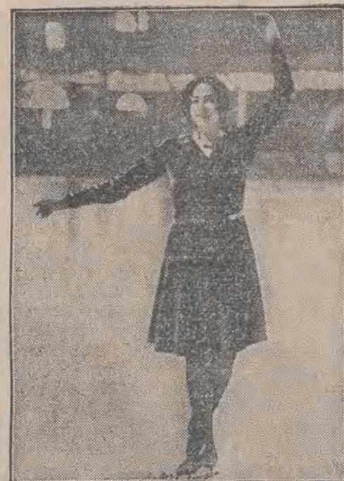
Maribel Winson uzyskała po raz czwarty tytuł mistrzyni jazdy na łyżwach w Stanach Zjednoczonych. Na olimpiadzie zimowej w Lake Placid Maribel Winson będzie groźną konkurentką Soni Henie w zdobyciu tytułu mistrzyni świata.