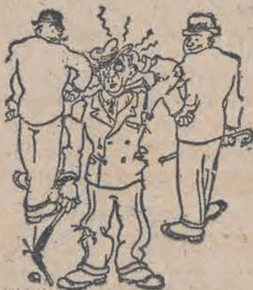
CZŁOWIEK, KTÓRY CHCIAŁ ZAPOBIEC KLÓTNI.

Od tej chwili rozpoczął się upadek. Biss znowu odwiedził Francję, był on kompletnie złamany duchowo i fizycznie. Przed dwoma laty udał się znowu za ocean. Na statku zameldował się pod przybranym nazwiskiem. — Śmierć Bissa wywołała niewątpliwie szczery żal wśród gangsterów amerykańskich, wywarła ona niewątpliwie silne wrażenie również na niejednym ze stałych bywalców Monte Carlo o niezbyt czystym sumieniu.