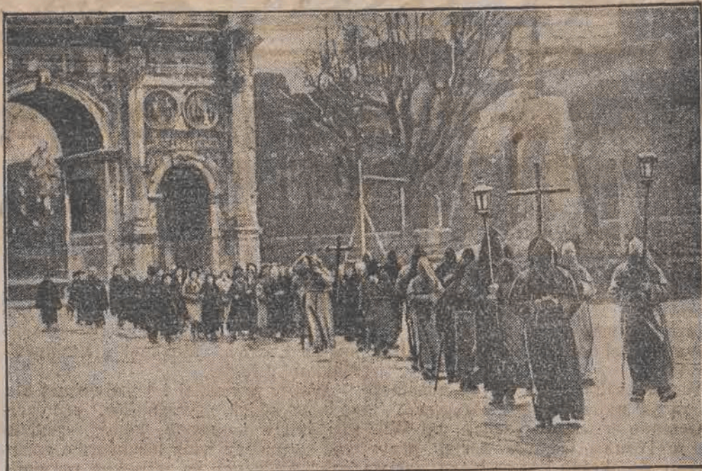
W czasie Wielkiego Tygodnia, członkowie zakonu duchownego „Ojców dobrej śmierci” odbywają codzienne procesje do Colosseum.