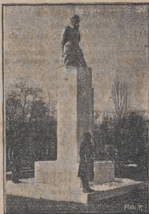
W dniu 19 b. m. odsłonięto przed „Domem Żołnierza” na Pradze w Warszawie pomnik Marszałka Józefa Piłsudskiego. Pomnik ten ufundowany został ze składek członków Związku Młodych Pionierów.