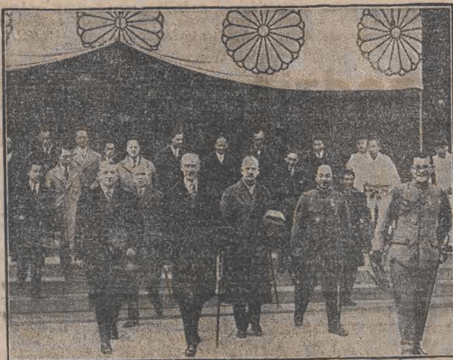
Komisja mieszana wysłana przez Ligę Narodów na Daleki Wschód celem zbadania tła zatargu o Mandżurję, przybyła obecnie do Tokio. — Na zdjęciu widzimy księcia Lytton (drugi z lewej) i generała Mc. Coy (z prawej — członków komisji).