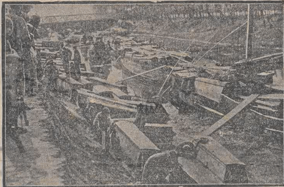
Po zawarciu rozejmu między Japonją a Chinami, chiński czerwony krzyż zajął się deportacją zwłok zabitych chińczyków do ich miast rodzinnych, celem pogrzebania.