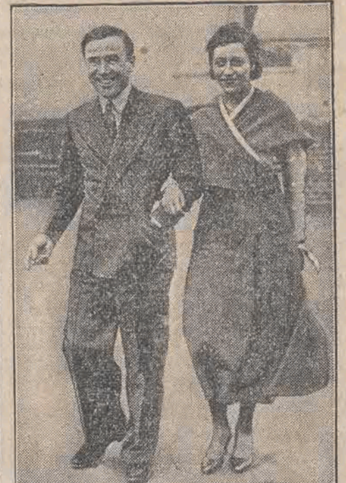
Znana lotniczka - rekordzistka Amy Johnson wysłała obecnie zamąż za znanego angielskiego lotnika - rekordzistę Mollisona, który odbył niedawno lot z Londynu do Kapsztadu.