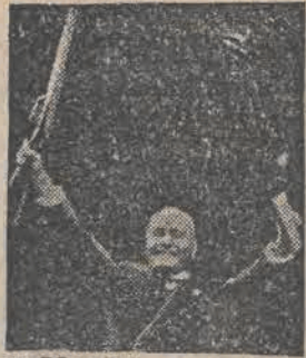
MUSSOLINI przemówił na zlocie studentów włoskich w Rzymie, oświadczył, że bronią studentów powinna być zawsze książka i karabin — na okres pokoju i gotowości do wojny w obronie państwa.