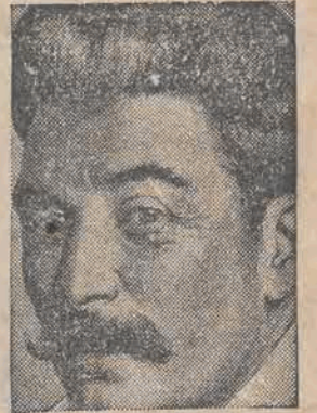
STALIN, dyktator sowiecki, zachorował i wyjechał na dłuższy urlop.