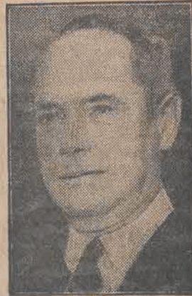
CHILD, b. poseł amerykański w Rzymie, mianowany został delegatem na międzynarodową konferencję gospodarczą.