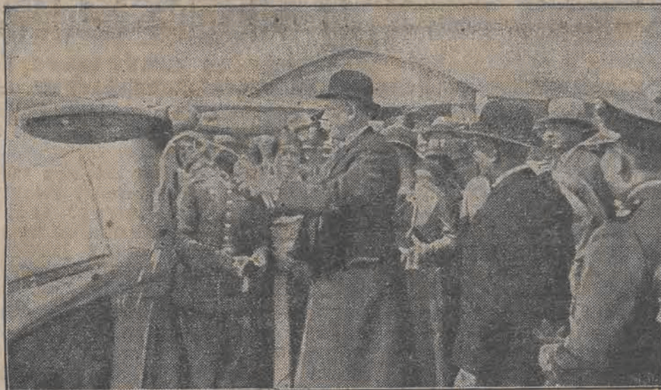
Pan Wojewoda Hauke-Nowak w czasie ceremonii „chrztu” aeroplanu, ufundowanego przez Związek Legionistów