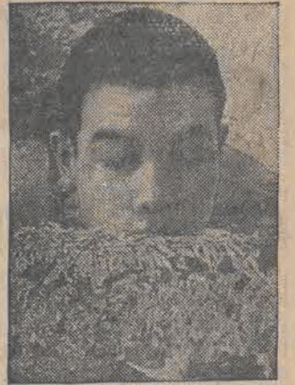
NEIZO KOIKE słynny pływak japoński u- stanowił rekord światowy na 200 metrów.