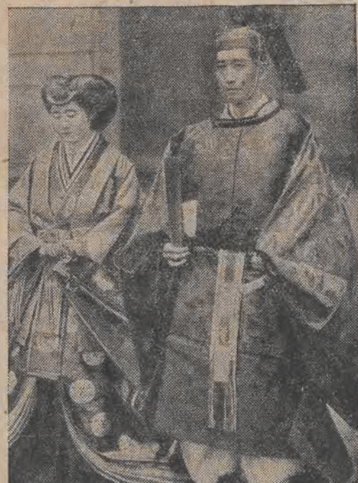
W Japonii tradycje zakorzenione są bardzo mocno. W tych dniach odbył się ślub księcia japońskiego Tsuneyoshi, na którym para młodożeńców wystąpiła w tradycyjnych strojach narodowych.