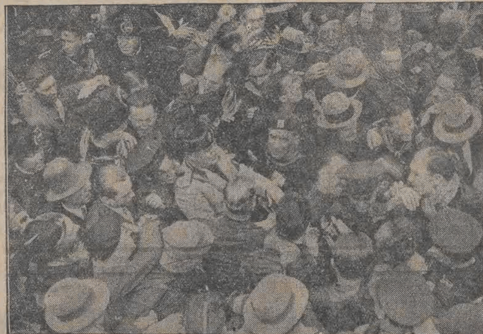
Kulminacyjnym punktem zjazdu b. uczestników wojny, włosków, polaków i belgów w Rzymie, był więc na Colosseum. Na wiec ten przybył Mussolini, witany owacyjnie przez uczestników zjazdu.