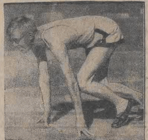
Ben Eastman, świetny atleta amerykański ustanowił nowy rekord światowy przebiegając 600 jardów w ciągu 1:08,8 sekund.