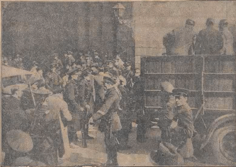
Rewolucja w Hiszpanji została stłumiona przez centralny rząd madrycki. Mimo to jednak trwają ciągle walki w różnych dzielnicach kraju. Na zdjęciu widzimy pogotowie wojskowe w Madrycie.