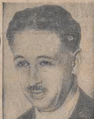
COMPANYS, prezydent automatycznej republiki katalońskiej, został aresztowany w związku z wypadkami w Hiszpanji.