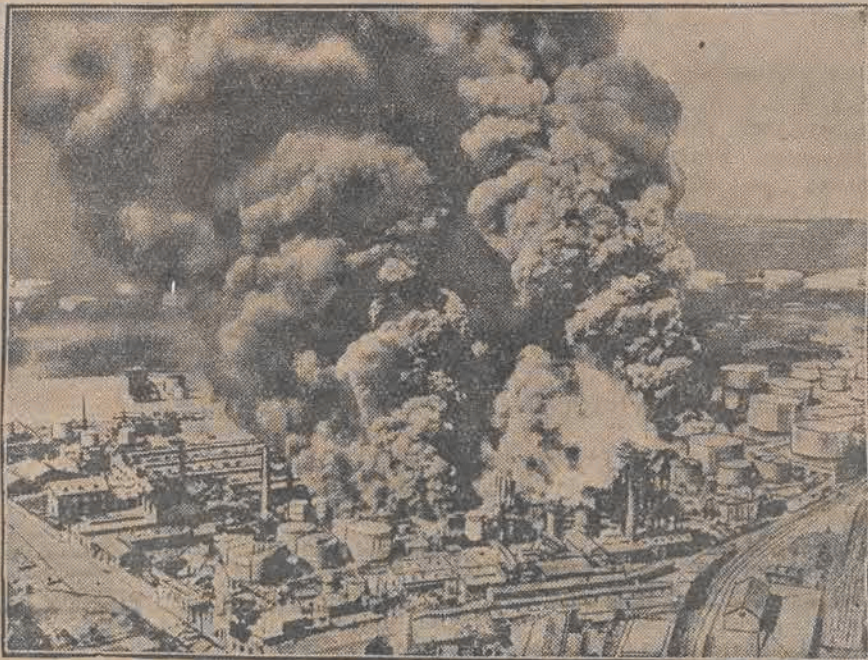
W mieście amerykańskiem Campana wybuchł pożar, który zniszczył niemal całe miasto. Straty wynoszą 3 i pół miliona dolarów.