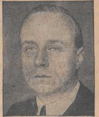
Von RIBBENTROPP, ambasador nadzwyczajny Rzeszy doprowadził do porozumienia morskiego Anglii z Niemcami.