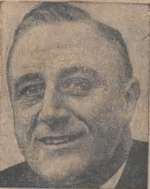
PREZ. ROOSEVELT wygłosił przemówienie, w którym przewiduje wybuch wojny w Europie.

ROK XIV. / ŚRODA, 8-GO STYCZNIA 1936 ROKU. CENA 10 GROSZY Nr. 8