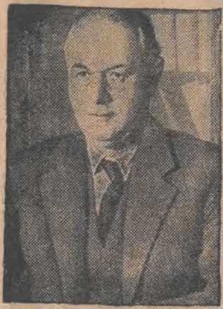
Sir THOMAS INSKIP, oblał w gabinecie angielskim tekę ministra obrony