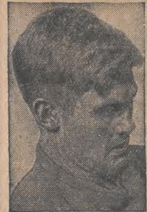
AMERYKANIN TOWNS zwycięzca olimpijski w biegu na 110 mtr. przez płotki

JAPOŃCZYK TAJIMA zdobył na Olimpiadzie złoty medal w trójskoce.