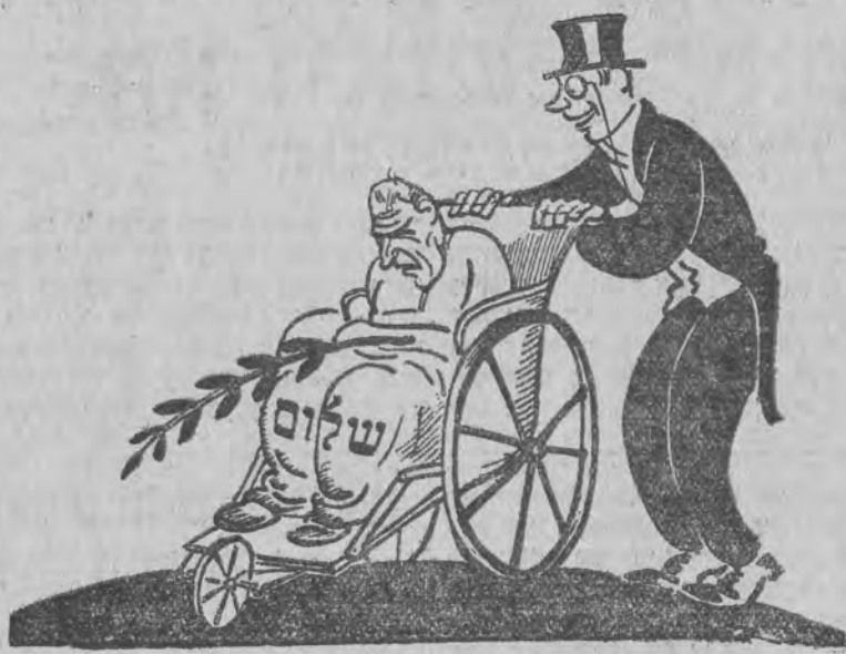
אזוי ווערט ער אויס...

מען רעדט אהין, אהער מען רעדט: בודזשעט און באהאלט בודזשעט; עס איז א טומעל, ס'איז א קאך, באך געה, פערשע זאך די גרויסע לאך, אז ס'איז גישאג מיט וואס... דיסקוסיע דא, דיסקוסיע דארט, מען שארט נישט - קיינער נישט - קיין ווארט, מען וועלט זיך, מען פליכט, מען שילט, מען רעדעט אויף א גאנצע וועלט, אז רייך איז דא - גיין מאס! דער שלעפער און דער עלענאנט - די ביידע טאפען איצט א וואנט, אז ס'איז דאך קריעת ים סוף ש'וער, און יעדער האט באך און בעזעהר דערשטען וואו א וואס!