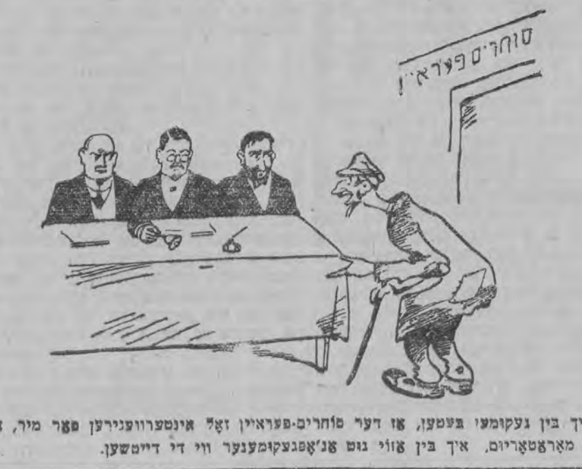
איך בין געקומען בעטען, אז דער סוחרים-פּעראַן זאָל אינטערעסירען פאַר מיר, איך זאָל בעקומען אַ מאַרשאַרױם, איך בין אַזוי גוט אַנאַפּעקומענער ווי די דײַטשען.

ד'מראפם פון א ווייב — וואָס אַ פּרוי קען אַלץ אויסטון. מערקווינדדיג איך האָב געקענט אַ יונגעמאַן, האָט ער נישט געקענט נישט לעזען, נישט שרייבען, אפילו זיין נאָמען האָט ער נישט געקענט אונטערשרײַבען. דער מענטש איז געווען אַ פּולקאַמענער ארױט, האָט ער חתונה געהאַט, און פאַר צוויי יאהר צײַט איז ער דורך דער ווירקונג פון זײַן פּרוי געוואָרען אַ געלעהרנטער מאַן. — ווייב איך אָבער פון אַ פּערקעהרטען פּאַל. איך האָב געקענט אַ יונגעמאַן, אַ געלעהרנטער, אַ וויסענשאַפטסטאַמן, אַ קלוגער, האָט ער חתונה געהאַט, און עס האָט נישט גענומען גאַנצע צוויי יאהר צײַט, נאָר נישט מעהר ווי צוויי טעג, און אונטער דער ווירקונג פון זײַן פּרוי איז דער מאַן געוואָרען אַ רענעלער ארױט.