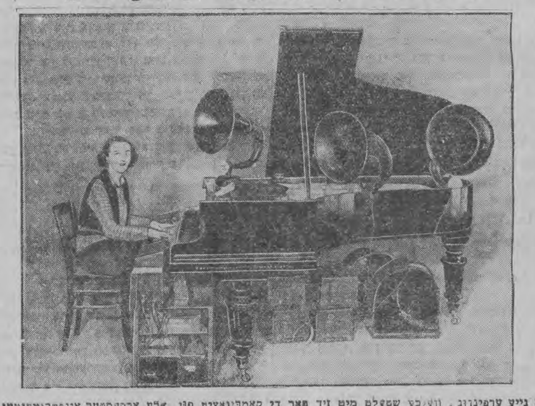
א נייע ערפינדונג, וועלכע שטעלט מיט זיך פאר די קאמבינאציע פון אלע ארבעטער אינסטרומענטען