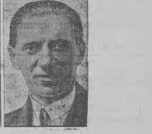
דער דייטשער ליפּטפליהער יאָהאַנסען נעמט אונטער אַ ריווע איבער'ן אָקעאַן אין אַרעאָפּלאַן פון בעריהמעסן לעוויין