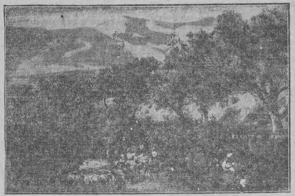
אויף דעם בעריהמעטן צו ג פּאַראַס נרויכענלעך איז אויסגעוואָקען אַ ווייגע וואַלד-שרפה, פון וועלכער עס זענען פּערברענט געוואָרען הונדערטער העקטאַר וואַלד.