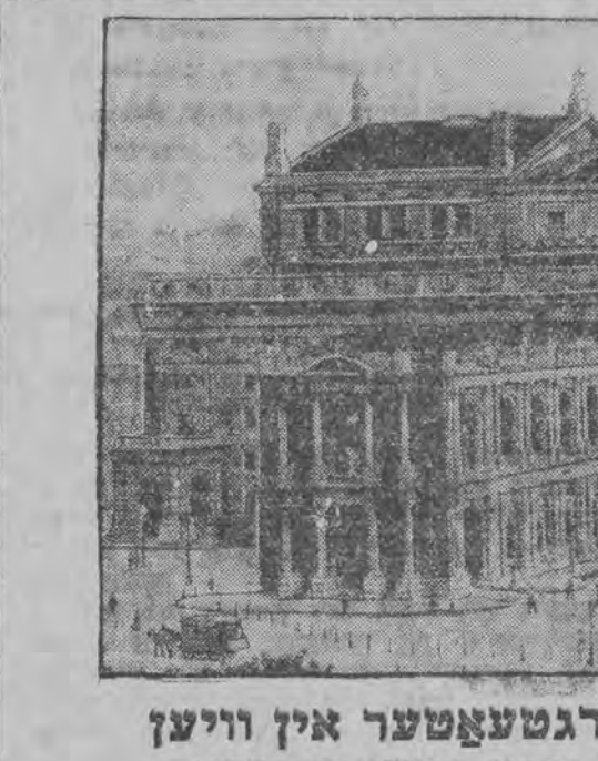
דער בעריהמטער בורגטעאָמער אין וויען וואַר צוליב שפּאַרזאַמקייט-מעמס נעשלאַסען ווערען

זעהט איהר שוין, אַז עס איז דאָ אַ גאַס אויף דער וועלט, וואָרים אַ שד אָהן אַ גאַס אין קיין שד נישט. - קלאַר, אַז דאָס איז דער זעלבער שד, וואָס מען בלאָזט איהם אַרויס פון שופּר. דאָס האָט איהם גאַט געשיקט אייך אויסצופּרובען. און דאָך האָט מען בעשלאָסען איינגלעדען מיליציע.