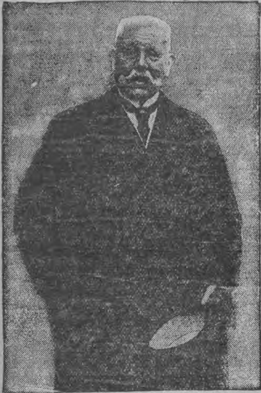
פרעזידענט הינדענבורג ווערט 84 יאהר אלט

גרויסע מיסברויכען אין וואר- שוער לאקאטארען-פעראייני- לייטער מיט דער סעקרעטארי האבען געמאכט שותפות