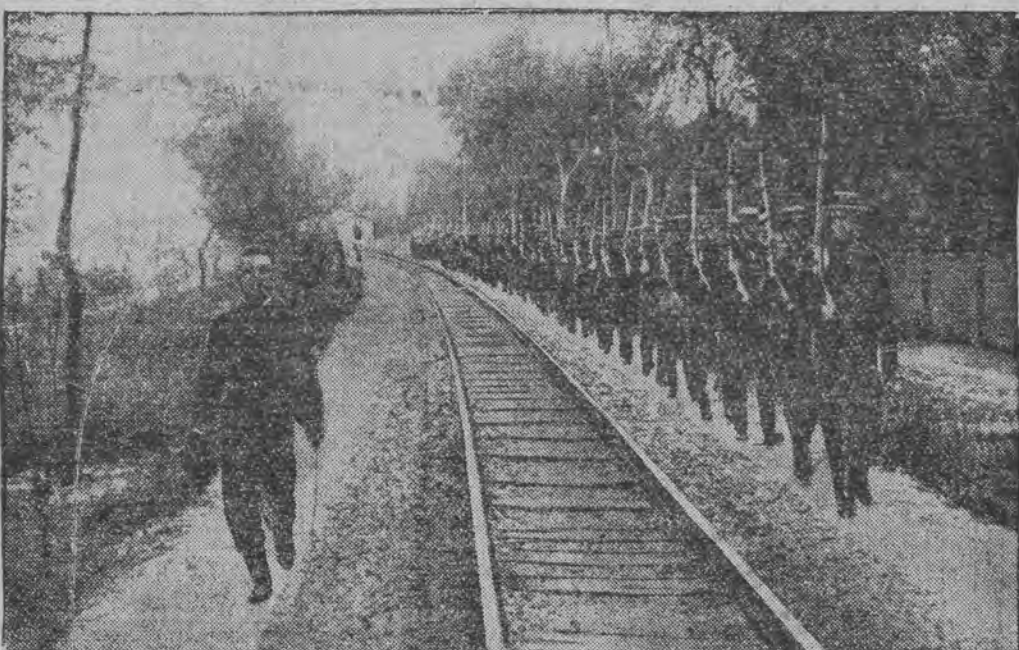
כּינעזישע זעלנער אויפֿן מאַרש פון מוסדעו סייין פעסון.

פאַר'ן וואָס פאַר אַ יודישער פּראָצעס! — ריכטיגער אַ פּראָצעס פון יודען אויף אַביסעל אַ נישט יודישער טעמע: — אַ כּלל, אַ טאַטע, אַ מעסער, רעסע און... פּעטש! — גאַר פרעהליך, דער ריכטער, ווען ערות, אַלע האָבען אַביסעל צוגע־שמיכעלט, ווען מען האָט אויסגעוואָפּען דעם נאַמען פון דער בעשולדיגער: — אַליס... צו דער בעשולדיגער געוואָנען איז אונדזרייט שווערע און אַ שווען יודיש מיינעלע. בעשיידען אַבער געשמאַק אַנגעטון, גרויסע שוואַרצע אויגען און שווערע שוואַרצע קרוינען אונטער אַ קליין קאַפּעל לוסעל. דאָס מיינעלע האָט געשוויגען און אַראַב־געלאָזען די אויגען.