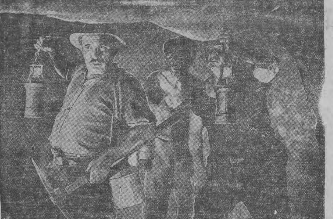
א בילד פון פילם "קאמערדשאפט"