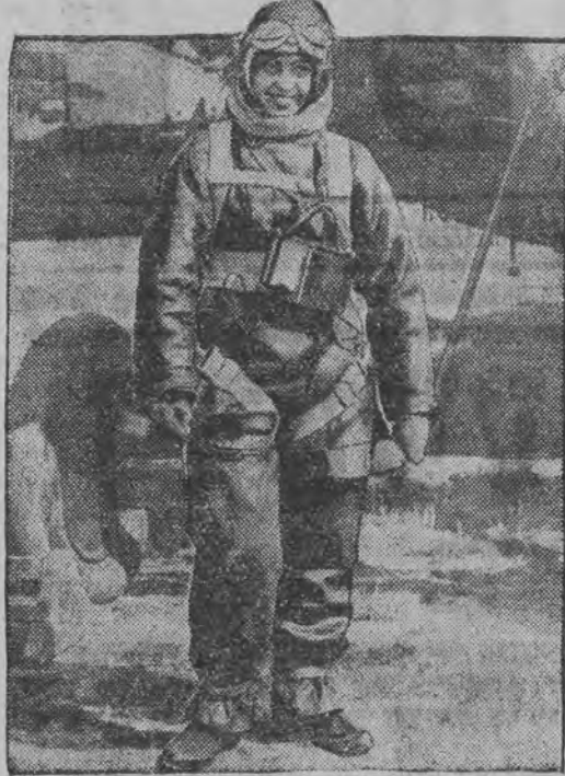
האט זיך ארעפאנאלאזט אויף א פאל-שירם פון 6000 מעטער הויך