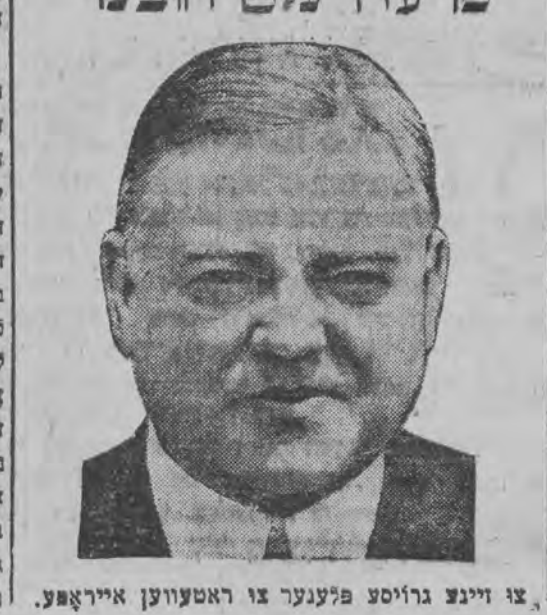
צו זיינע גרויסע פלענער צו ראטעווען איראפע.