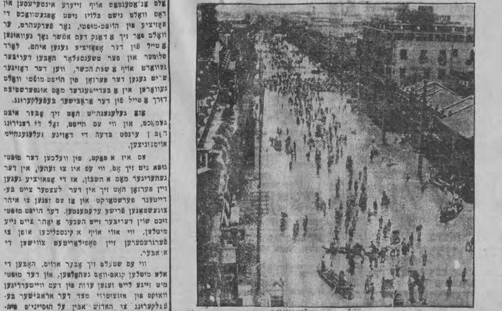
א פילד פון דער פערפלייצטער שטאם האנקאן

די פערשטארקטע אפאזיציע פון ירושלים'ער הויפט-מופטי האדושי אמין על הוסייני איז צוגעאייילט געווארען א דאנק דער פערשטארקטער אפאזיציע צווישען דער אראבישער בעפעלקערונג געגען די מעשים פון דעם מופטי צוליב ד, ר ליכטוויניגקייט מיט וועלכער ער בעהאנדעלט איהרע א טערעסען, עס איז א פאקט, אז די א.י. אדמיניסטראציע איז שוין פון לאנגע יאהרען נישט צוהיירען פון דעם מופטי און זיין אויפפיהרונג. נישט בלויז לארד פלומער, נאר אפילו סער נשנסעלאר האט טען-פראגע, געהערט לעטלאנד און ספס צו די וואס האבען ארויסגעוויזען פיל גוטע ווילען און אן-אויפריכטיגע כוונה צו שאפען גינסטיגע בעדי-נער.