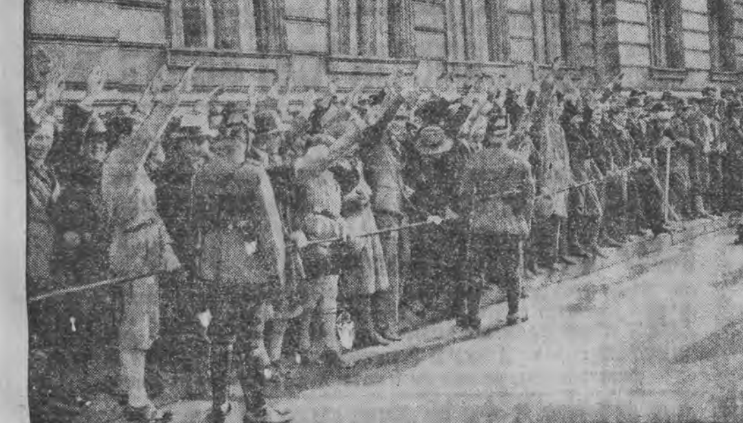
1 / 1 זיין אוידיענץ בייים פראעזידענט הינדענבורג.