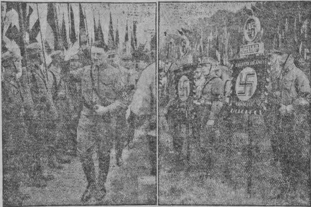
היטלעריסטן מיט זייערע פנהנער. היטלער נעהמט אפ דעם פארדא פון זיינע אפטיילונגען