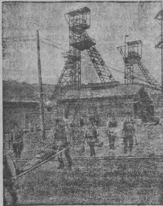
א בילד פון דער קאטאסטראפע אין זעלבן ארט אין יאר 1921, בעת וועלכער ס'זענען אומגעקומען 79 מאן

ווארשא, 20 (טעלעפאניש פון אונזער קאָר-רעספאנדענט) די היינטיגע זיצונג פון סיים איז געווען ווי מיר האבען פאראיינענדיקט, א זעהר שטרמישע. אויפ'ן טאג-ארדנונג האט זיך געפינען די פראגע פון ענדערען דעם סייס-רעגולאציען אויף דעם אופן, אז מען זאל נישט קענען רעדען מעהר ווי 10 מינוט, מיטאל נישט קענען אריינבראען קיין איבערשלאגענע א. א. ו. די אפאזיציע האט זיך געהייט צו דער דא-זיגער זיצונג און ווען דער וויצע-מארשאלעק צאר, דער מחבר פון די דאזיגע ענדערונגען, האט געוואלט בעהמען א ווארט, האט די אפאזיציע איבערגע-דענט אבאסטרוקציע, אזוי, אז דער מארשאלעק האט געוואלט אפגייען און זיצונג. א גרויסע רעדע געגען די ענדערונגען אין רעגולאציען האט געהאלטען דעם פונשאק פון פ.פ.ס. וועלכער האט געזאגט, אז די סאנאציע, וועמענס סוף איז געווען, שטרעבט איצט מיט אלע דער-לאבארע און נישט-דערלאבארע מיטלען צוצו-מאכען דאס מיל-דער אפאזיציע, וועלכע ווויזט אויף די פעלערען פון דער רעגירונג.