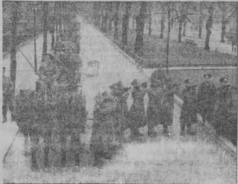
סאָלדאַטען פון רייכטוועהר געבען צו וויסען דורך בלאַזען אין טרוממען, אז עס הויבען זיך אָן די זאַמלונגען אין די הייזער אין בערלין.

יק"א האט נישט געהויפט היין ערד-שטחים אויף פאלעשיע ערטהערונג פון יק"א ווארשע, 21 (יט"א טעלעגראפיש) אויף אַנאַמערנע פון יק"א, האָט יק"א ערקלערט, אז די ידיעה אין דזש. ווילנעסקי וועגען דעם, אז יק"א זאָל האָבען אַפּגעקויפט גרויסע ערד-שטחים, כּרי צו בעקעצען יודען פון פוילען אויף פאלעשיע, ענטשפּרעכט נישט די ווירקליכקייט, די ידיעה האָט קיין שום גרונד נישט.