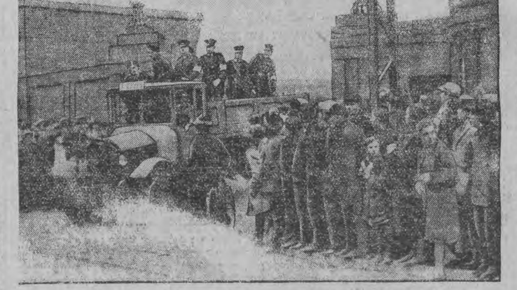
אנאליסא מיט א רעמונגס-סאַנשאַפֿט פּעראַלאַט דעם גרובען.

א בילד פון דער גרויסער קאָנסטראַקט אין וועסטפּאַלען