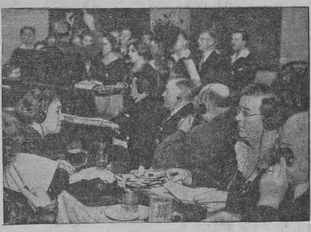
די לייזערע זענען דערביי געווען פערזענען מיט ספעציעלע אפארטמענטן.