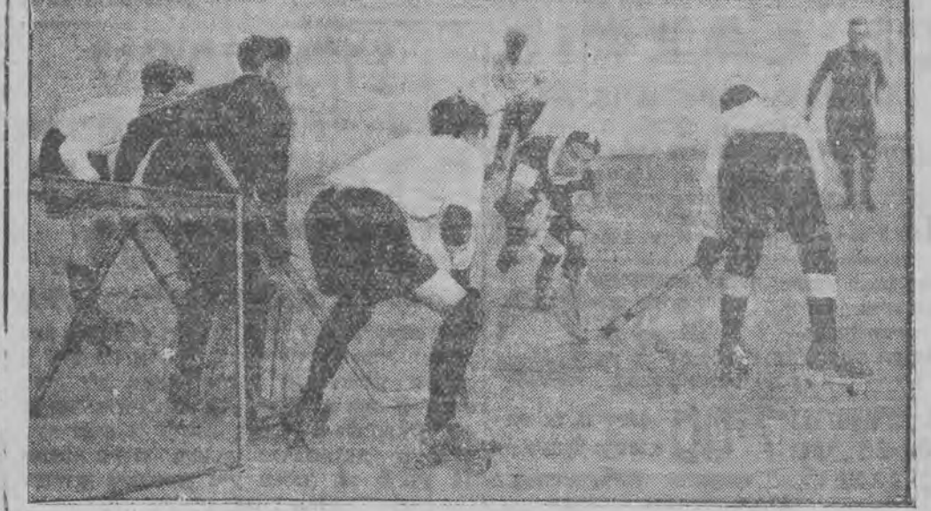
האַמטע אויף ראַל-שיך בעקומען אלץ מעהר אנהענגער.