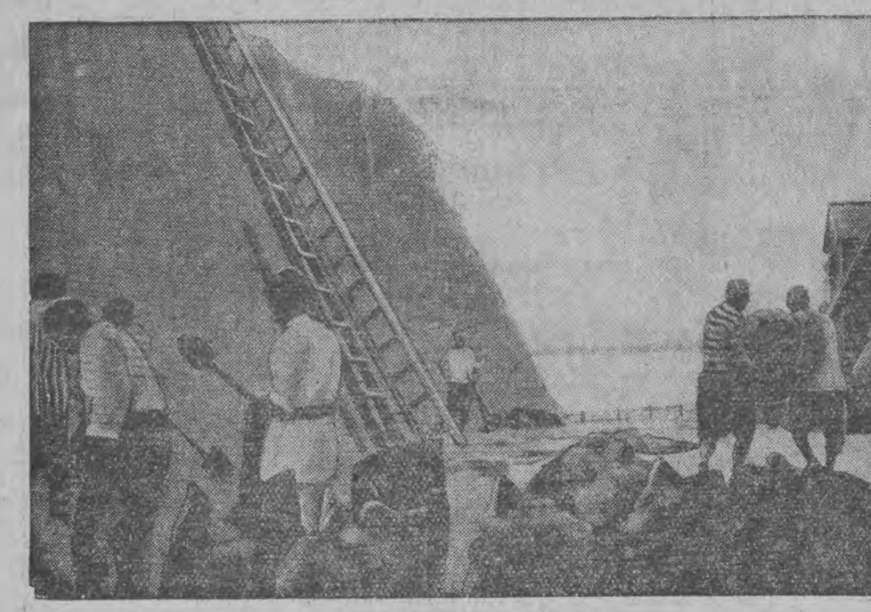
די איינוואוינער קאכען זעלץ פון ים-וואסער (אזוי ווי דאס האבען געטון די אינדוסען).