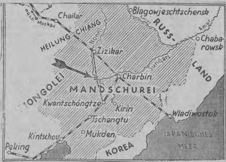
דער צייכען ווייט די ברוק איבערן טייך וואו עס קומט פאר דער קאמף צווישן יאפאנער און כינעזער

פאר דער בעזעצונג פון מאנדזשוריעז דורך די יאפאנער