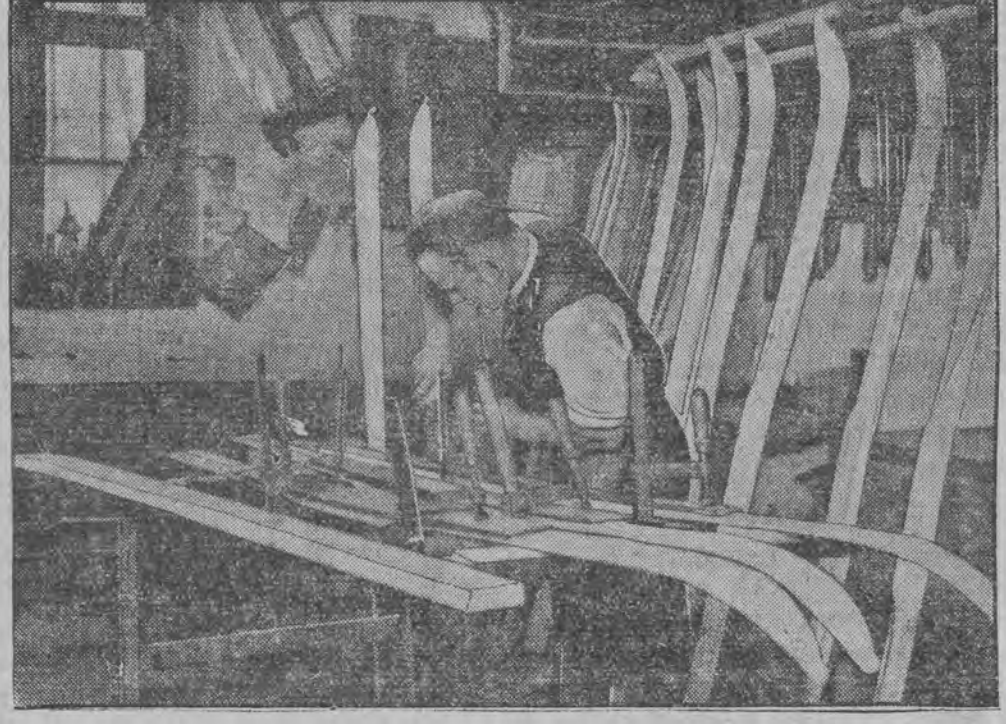
טיילער-ווערקשטאט וואו עס ווערען אויסגעצויגן נארטס.

דר. מ. וואלפסאן האט זיך איבערגעצויגען נארוטאוויטשא (דזשעלנא) 2 טעלעפאן 128-83 נעמט אן פון 5 - 7 נאכמיטאג