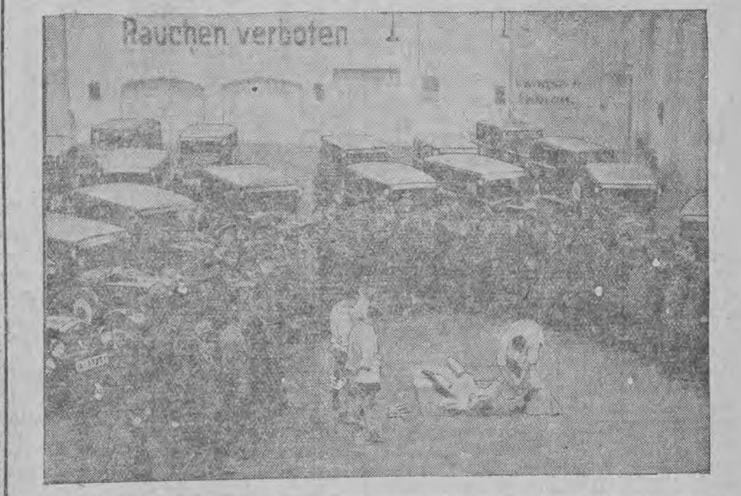
בערלינער שאפערען ווערען אויסגעבילדעט צו פערטיידיגן זיך געגען באַנדיטען וואס איז געשלאָסען געוואָרן

קיין דמשק איז אָנגעקומען אויף זיין צוריק-רייע פון אינדאָ-בויב דער פראנצויזישער קאַלאַ-ניאַל-מיניסטער פאַר ריינא. לכבוד דעם פראנצויזישען מיניסטער איז איינגעפּרענט געוואָרען אַ מיי-פּרעליכע אויסנאָמען, דער פראנצויזישער קאַלאַ-ניאַל מיניסטער האָט אויך בעזוכט באַנדאַד. פאַר ג.ד. (י.ט.א.) אין באַנדאַד ווילט איצט דער פּרעזישער אויסער-מיניסטער, וועלכער פיהרט אנטערהאַנדלונגען מיט דער רעגירונג פון איראק וועגען א רייע שטרייט-פראגען. ווי מען רעכענט וועט אין קורצען געשלאָסען ווערען א האַנדעלס-אַפּמאַך צווישען פּערסיען און איראק. אַמאַן (י.ט.א.) די רעגירונג פון הערדשאס - נעדוש האָט פאַרגעלענט די רעגירונג פון עבר-הירדן וועגען שליסען אַנאַפּמאַך צו ענטשטייען אלע שטרייט-פראגען דורך אַנאַרביטראזש לויט דעם וואס איז געשלאָסען געוואָרן