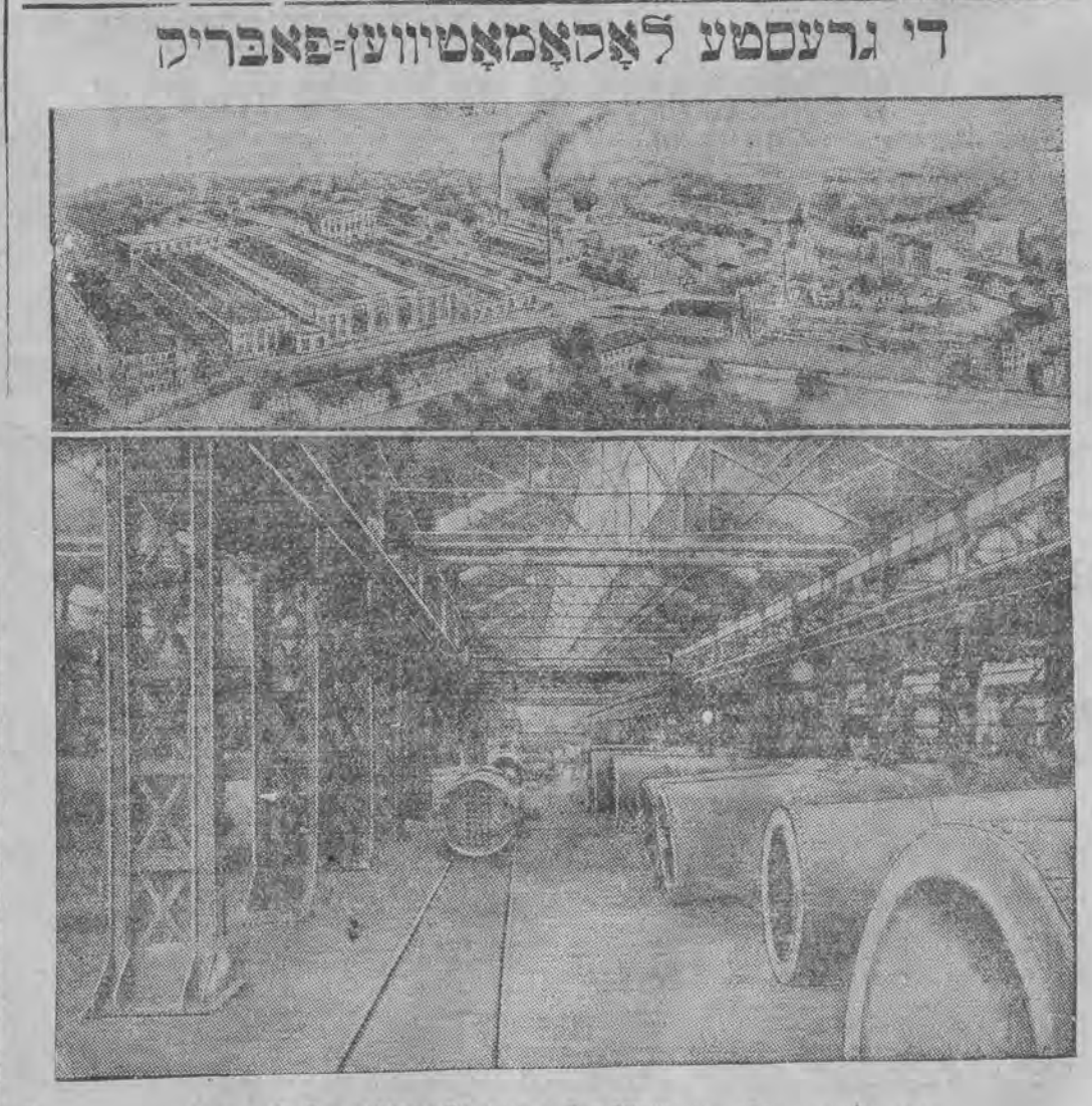
איז איצט פערענדיגט געווארען אין אמעריקא איבערז הארסאן-שייד