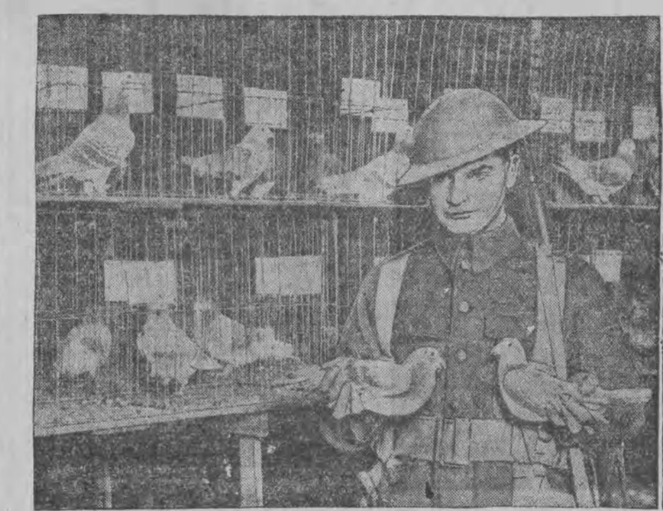
צוויי פאסט-טויבען, וועלכע האבען דרוכגעמאכט דעם וועלט קריג אין דער פונלישער ארמע- י