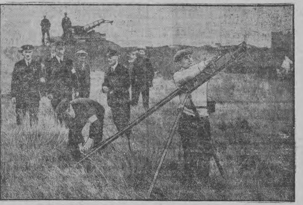
צוליב די גרויסע שטורעם אין די ענגלישע וואַסערען האָבען איצט די רעגירונגס-פאַטרולען זעהר פיל אַרבייט