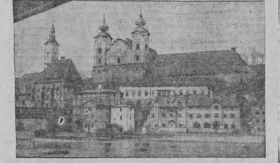
די עסטרייכישע שטאט סטאיר געפינט זיך אין א קאטאטראפאלער סיטואציעלעך לאנץ צוליב די שוועריקייטען פון דער דארטנער אויטא-אינדוסטרי