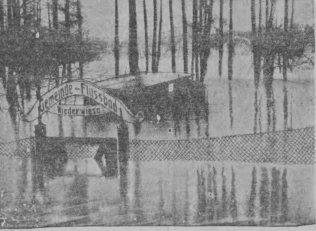
א בילד פון דער פערצלייצונג ביי בעטניע

אין ברוינשווייג האט דאס וועטער פערנוכט שטעט די באהן ליניע נעבען הארצב. רג. 400 מעטער