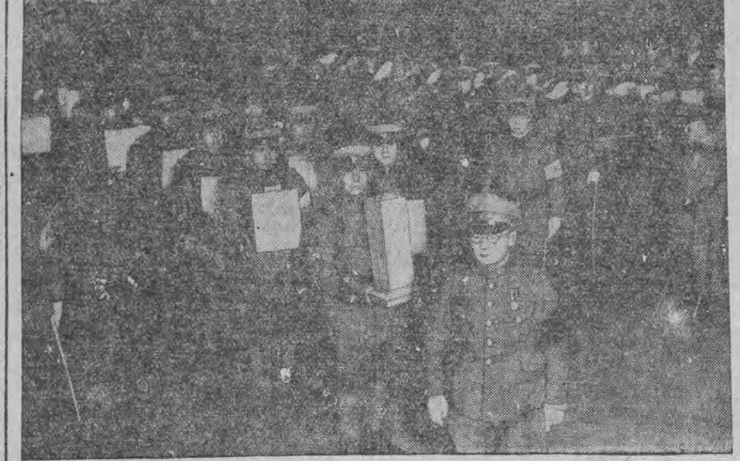
לויט די רעליגיעזע אַנטי-אונגען פון די יאַפּאַנער מוז יעדער געפאלענער יאַפּאַנער געבראכט ווערען צו קבורה אין דער היימלאַנד. די אַש-אורנעס פון די געפאלענע זעלנער אין מאַנדשוריען ווערען דערביי געבראכט קיין יאַפּאַן, וואו זיי ווערען בעגראָבען.

דייר סהאָן בערייטע דאָן די פּראָגע ווערען דער מעגליכקייט פאַר די רעוויזאָניסטען צו עקזיס-טירען אַלס זעלבסטשטענדיגע אַרגאָניזאציע.