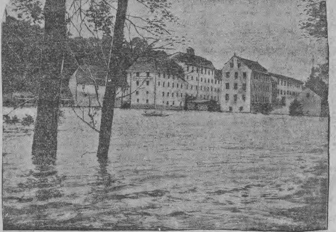
א פערפלייצטע גאס אין גערליץ