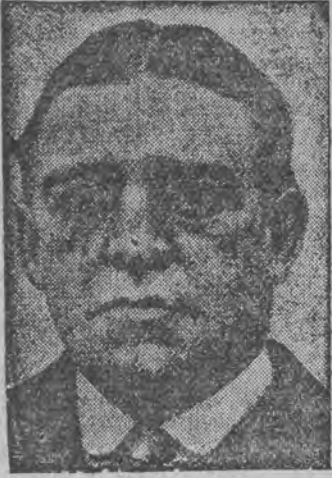
דער בעריהמטער פארשער פון דרום-פאל, צום צעהנטען יאהרצייט נאך זיין פליט