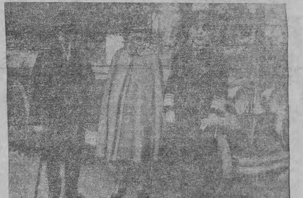
פון לינקס: באַמשאַפּטער סאַסאָ, גענעראַל מאַסאַ, וויצע-אַדמיראַל נאַנאַ.