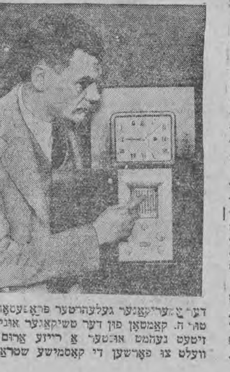
דער „עלעקטרישער געלעהרטער פראצעסאר“ פון טה. קאמטאן פון דער שטיקאנער אוניווער- זיטעט געמחט אנטעל א ריינע צורום דער וועלט צו פארשען די קאמפישע שטרעהלען.

די בעטע וואס מיר שילדערען דא, ווערט אנגעזען פון א פאלסט און זי דערזעהלט זיך אזוי: די אקאלע אינדיאנער, איבער פון די מוטיג- סטע אינדיאנישע שבטים, האט זיך צוגענומען געווען דער וואשינגטאנער רעזידענט, האט אויסגע- גראבען דעם „טאמאהאק“, ווי מען רופט עס אויסן אינדיאנישען לשון; דאס מיינט, זיך גענומען צו די כלי זיין און דערקלערט מלחמה. כדי צו פערמיינען בלוט פערטונג, האט די רעזידענט געשיקט צום אמרעהיגען שבת א קאטוי- לישען ביטאף, וועלכען די אינדיאנער האבען רע- ספעקטירט, ער זאל אנטערהאלדען מיט די ווע- גען א שלום. דאס איז געווען איינמיטען ווינטער. דער ביטאף האט געטראגען א זעהר טייערען פעלץ וואס ער האט, אין די צייט פון די פירדענס פערהאלדער- גען, אויסגעטון, אוועקגעלענט אין א זיס און זאין גאנצען פערזענען אין איהם. שפעטער האט ער זיך דערמאנט אויף זיך טייערען מלבוש, אבער דער פעלץ איז געווען פער- שוואנדען. זאגט זיך נישט — טרייסט איהם דער אינ- דיאנער טשיף — דער פעלץ וועט זיך גענוגען, ווארומ קיין אינדיאנער גנבים זענען נישטא. און איהר זייס איצט דער איינציגער ווייסער אויף מילען צורום. אין כך הוא: אגאינדיאנער האט דעם פעלץ געפונען און איהם אויסגעהאנגען, ווארטענדיג ביו דער אייגענטימער וועט זיך מעלדען. דער צוועק, צוליב וועלכען די געשיכטע ווערט דערזעהלט, איז א דאפעלטער: ראשית, צו בעווייזען די עהרליכקייט פון די אינדיאנער, אז עס זענען ביי זיי נישטא קיין אינדיאנער גנבים, והשנית, אויב שוין יא א גנב, מוז עס זיין א ווייסער.