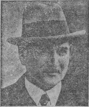
גענעראל לייטנאנט פראנץ פון עט.

אויבער פון די ספארטלייט איז געווען הער קאלען ער האט זיך צוגעשטעלט צו דער אינדיאנער מיר דעל און איהר פערזענלעכע, אז ער האט זי ליב. זי האט איהם געלייבט. און פארוואס זאל זי איהם נישט גלייבן? פארוואס זאל ער איהר זאגן א ליגען? געווען איז דאס שפעט אין הארבסט. עס איז שוין געווען שטארק קאלט און דער „שווארצער אדלער“ האט זיך גענומען צו זיינע יאנדען. ער איז זעלטען געווען אין דער היים, און הער קאלען פלעגט אפט קומען צום בעזוך. די מאמע איז געווען צופיל בעשעפטיגט זי האט בעדארט צומאלען קארן, אויסטריקענען פלייש, פיש, אויפגייען קליידער פאר די קינדער און פער ריכטען דאס הויז געווען די ווינטערדיגע שטרימעס. זי האט קיין צייט נישט געהאט אויפצופאסן און קאלען פלעגט געהען שפאצירען מיט איהר טאכטער ביו שפעט אין דער נאכט. אזוי האט עס געדויערט עטליכע וואכען, און דאן איז ער אוועקגע- פאהרען ערגעץ ווייט א היים. אין פריהלינג, ווען דער טאטע איז כשריג געווארען מיט זיין „ארבייט, האט איהם די טאכטער מיטגעטיילט, אז אין א פאך חדשים צורום וועט זי ווערען א מוטער און דער פאטער פון איהר קינד איז הער קאלען, וועלכער האט איהר פערשפראך קען צו קומען וואוינען מיט איהר פארן גאנצען לעבען. דער „שווארצער אדלער“ האט שוין אביסל געקענט די ווייסע און ער האט ערקלערט אז ער האט אויף איהר שטארק פראיאבעל, פארוואס זי האט איהם מיינער נישט געפרעגט, נאר פערפיר- לען, זיצט מו ער רעדען מיט הער קאלען און איהם דערמאנען אויף זיין פערשפראכען. עס האט געדויערט לאנג ביז ער האט אויסגע- פונען, וואו דער ווייסער געפינט זיך און מיט צוויי חדשים שפעטער האט דער אינדיאנער צווייטער- מראכט אט דעם גרויס; הער קאלען איז פערהייראט, ער האט א