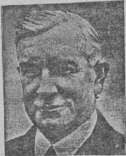
זאל ווערן אמעריקאנער באַטשאַטער אין לאַנדאָן