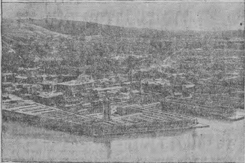
אויבען: א פאזאש ביינאכט, אונטען: א בילד פון האנדלונג, הויפטסטעס פון די האוואיאישע אינזלען

ווארשא, 19. (טעלעפאני שפון אונזער קאָרעספאנדענט) אויף דער היינטיגער זיצונג פון דער ביהודישע-קאמיטע אין בערלין געווארען דעם ביהודישע פון האנדלעס-מיניסטעריום. דעם ביהודישע האָט רעפערירט דעם מיניסטעריום (ב.ב.) דער רעזולט אין אַנאַליטישע און האלט צו מיר וועלען דעם קריזיס בשלום איבערקומען, ער וויינט אַז די פראָדוקציע אין אַמייסטען געפאלען אין דער אַגראַ-וויירטשאַפט. מיט צופרידענהייט האָט ער אונטערגעשריבען די רעפאָרם אין אומגעפער שטיי-ער, ער איז אויך קאָנגרעגאָרע פון דער קארטעל-ליזאציע. דער רעפערענט רעדט אויך ברייט אַרום דאָס פראָבלעם פון פאַסיווען האַנדלעס-בילאָנס און האַלט אַז דאָס איז אַ סחוק, וועלכען מ'וועט אַזוי שנעל גיטט אויסגלייכען. אַנדערע לענדער האָבען ביליגער געמאַכט זייער פראָדוקציע דורך אַראָפּדריקען די וואַלוטע, מיר וועלען אויף דעם דאָזיגען וועג נישט געהן, מיר מיר זען אַבער ביליגער מאַכען אונזער פראָדוקציע דורך אַ רעוויזיע פון די לוינען אין דער אינדוסטריע און דורך אַ רעוויזיע אין די פּינאַנץ-סיסטעמען אין די אינסטיטוציעס פון די סאַציאַלע פּערזענליכע, מיר דאַרפען אַ גאַנץ נייעם גאַלט-טאַריר און זיך פּער-פאַנציען. דער רעפערענט איז אַבער געווען די מע-שידנעקע מאָנאָפּאָלען וואָס ווען ער איינגעפיהרט גאַנץ רעפערענט פון דעם מיניסטעריום האָט זיך ענטוויקעלט אַ גרויסע דיסקוסיע בעת וועלכער עס