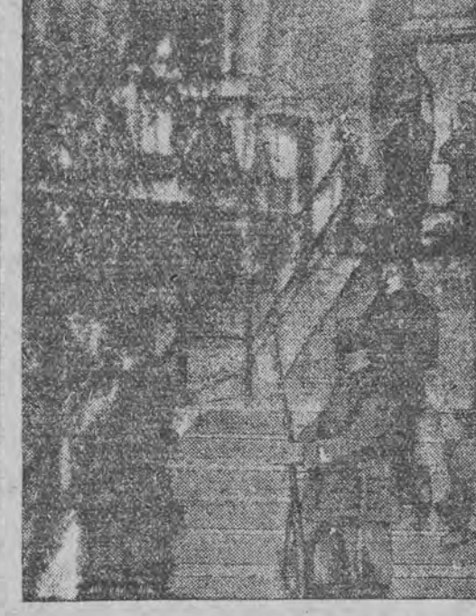
פאליציי בעוואכט די תפיסה אין בילבאא