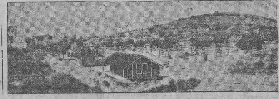
א ארייטער שטאָרט אין די בראַזיליאַנישע גומי-פּלאַנטציעס פּון הענרי גרינער.