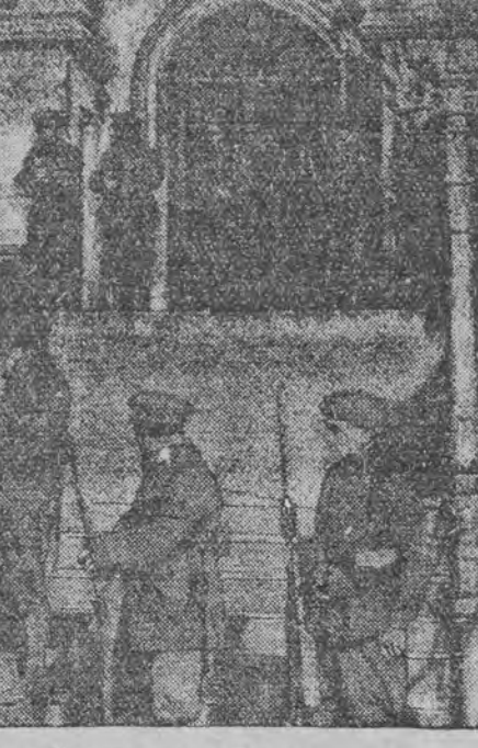
פאליציי בעוואכט די תפיסה אין בילבאא