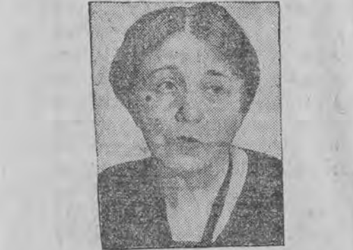
פּרױי קאַראַוואַל, אין די ערשטע פּרױ, וועלכע איז געוועהלט געוואָרען אין אַמעריקאַנער סינאַג.

אין קאַלעניאַל-אַמט האָט מען ווייטער ער-קלערט, אז אַיפּער-מו'ועט אָננעהמען פּרענטש'ס בעריכט, וועלען מריהער אויסנעהערט ווערן מי-נונגען פון די פּראָנציפּאַלע צדדים, ד. ה. יודען, אראבער און ארץ-ישראל-רעגירונג, ערשט דאַמאָלס וועט אָנגענומען ווערן א שטעלונג צו ווענטש'ס בעריכט. ביז איצט, ערקלערט דער קאַ-לעניאַל-אַמט, זענען אלע ידיעות וועגען פּרענטש'ס בעריכט גרונדלאָז.