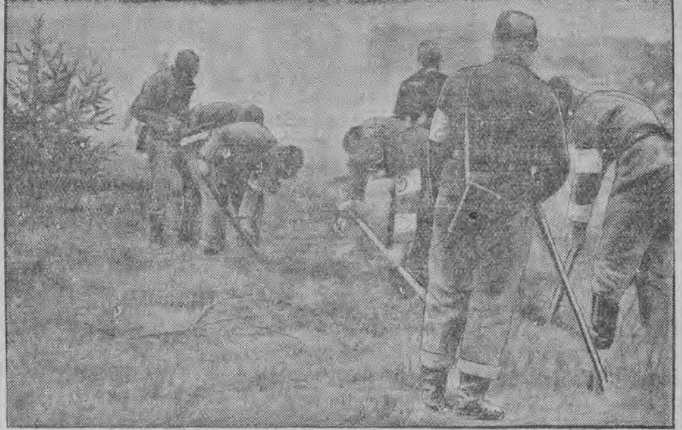
איבונגען צו לעשען א וואלד-בראנד ביי ליבעק