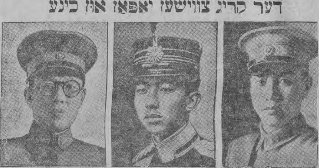
דער קריג צווישען יאפאן און כינע מיטאנאקאישע דער אבערקאמאנדיר פון דער כינעזישער ארמעי. היראכיימא דער יאפאנישער קייזער (מיקאדא). וודושען טשען געו. כינעזישער אויסער-מיניסטער, ארגאניזירט דעם ווידערשטאנד פון כינע געזען יאפאן.

כינע האט נישט ערקלערט קריג יאפאן לאנדאן, 1 (פ.ס. טעל.) פארן פערלאזען נאנקין האט דער כינעזישער אויסערמיניסטער קאטעגאייש אפגעלייקענט די ידיעות, אז די כינעזער האבען ערקלערט קריג יאפאן. די כינעזישע רעגירונג וועט גישט ערקלערען קריג, נאך וועט פערטיידיגען סילאנד ביזן לעצטען טען טראפען בלוט.