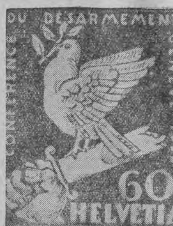
די ענטוואפנונגס-מארקע | דער עלעקטראל-פאלאץ, וואו ס'קומט פאר די קאנפערענץ