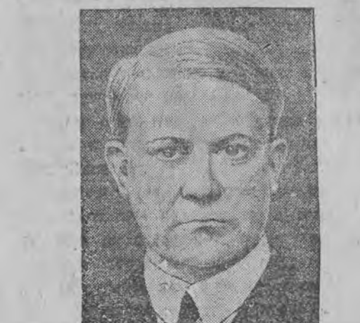
דער נאציאנאלער קריגס-מיניסטער קלומעל אויף וועלכע עס איז אויסגעפירט געווארען א שווער-אשע:טאט.

ווארשא 7 (י"א טעלעפאניש) אין לא-האר פון דער פאליטישער-אונטער-עסטראכען קאמער אין פערזענלעכע די פיינליכע ערעבונג פון א שטענדיגע אויסשטעלונג פון ארץ-ישראל פראדוקטען. די ערעבונג-רעדע האט געהאלטען צוויי טעג, אין נאמען פון דער ציון, עקזעקוטיוו און פון דער אגענץ האט בענדיקט מארשטיין, א. נ. פון ציוניסטישע צ. ק. ד"ר קלומעל, ריכער זיידע האט בענדיקט א. נ. פון דער ווארשאנער אונטער-עסטראכען אויף דער ערעבונג אין אויך אנווענד געווען דער וויצע האנדלעס-מיניסטער, אשע:טאט.