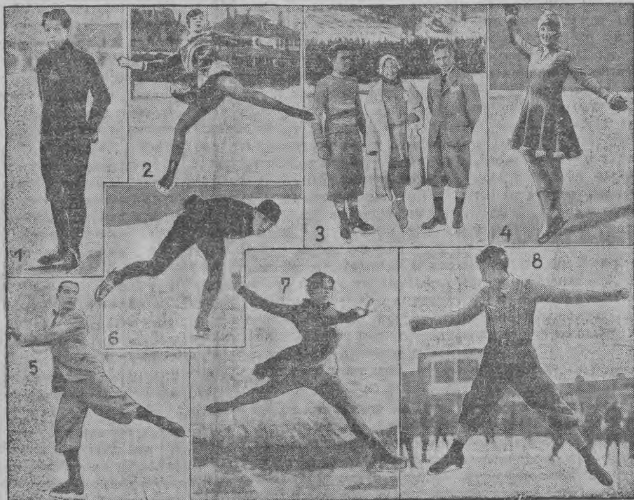
די מייסטער פון קונסטלויפן אויף אייז

אוהיב פון דער ווינטער-אלימפאדע אין לעיה פלעסיד (מינעריהע)