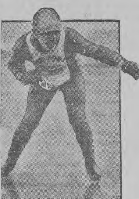
אירחיו דושעפי (אין 5000 מעטער אייז-לויף)