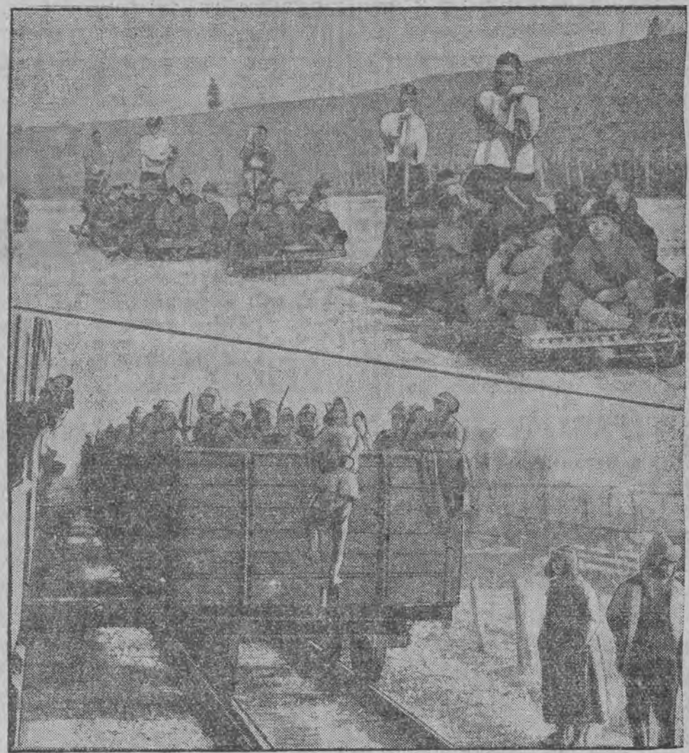
אויבען: כינעזישע פרויען אין קינדער ווערען אוועקגעפיהרט פון פראנט אונטען: טראנספארט פון מיליטער