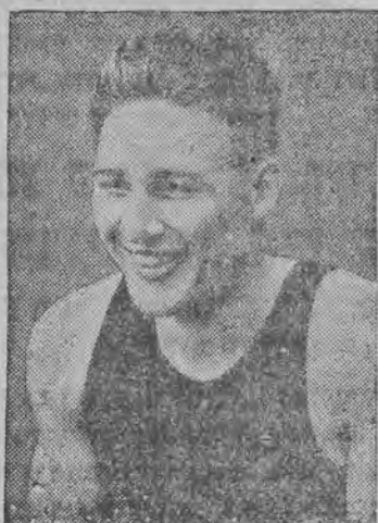
דער בעסטער אמעריקאנער ספאָרטסטען פון יאָהר 1931

שען פערבאנד פאר ספאָרט-שפילען ווען פאָרק-מען אין לאָד, דעם 20 און 21 פעברואר, די קאָקיינען געהמט איום מענער-מאנשאפטן און פרויען-מאנשאפטן. די קאמפן וועלען זיין זעהר אינטערעסאנט, ווייל ס'זעהמען אַנטווייל אונלעכערשטקלאַסיגע מאנשאפטן, ווי: ל. ק. ס. (לאָד), א. ז. ס. (וואַשאָ), פּאָלאַניא וואוּ שאָן און קראָץ, ווער קלובער.