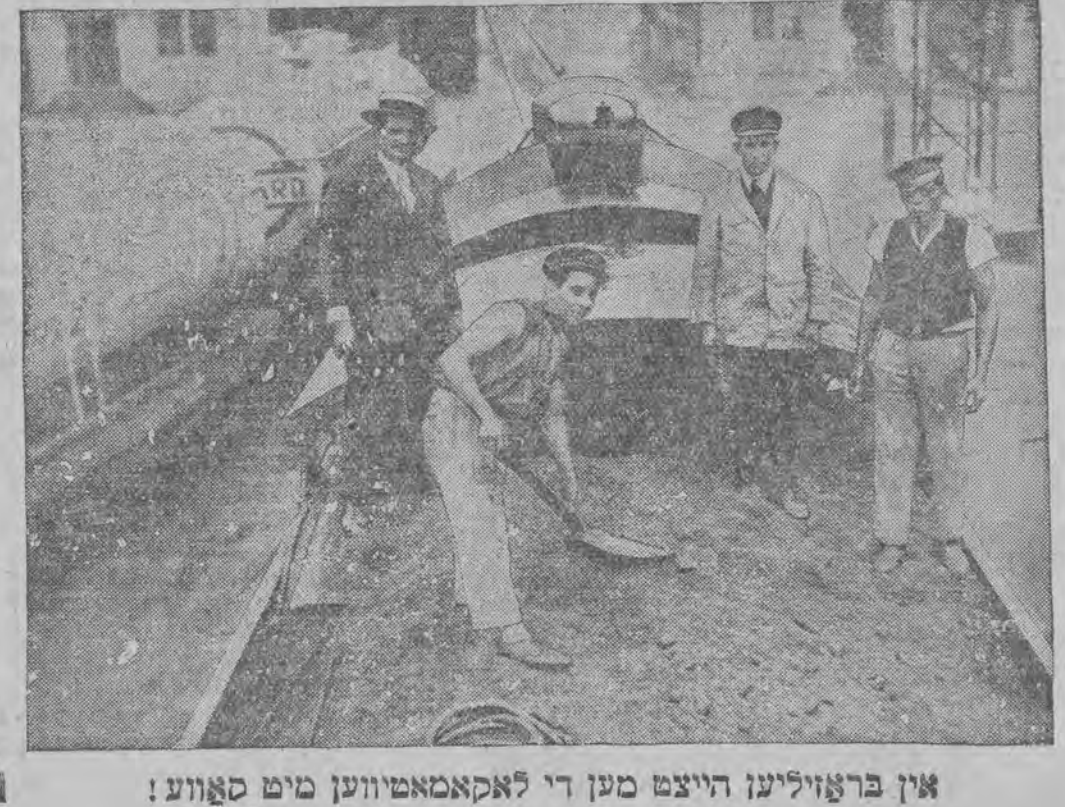
אין פראויליען הייצט מען די לאקאמאטיווען מיט סאווע!