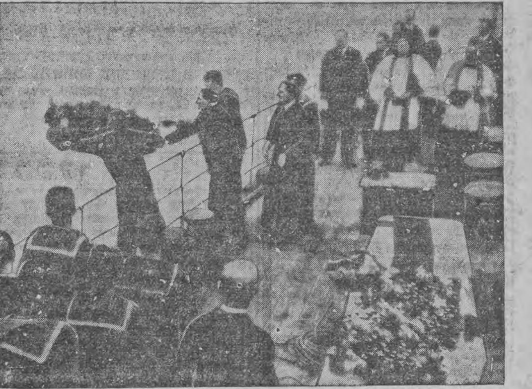
אויפ'ן ארט פון דער קאטאסטראפע ווערען אריינגעווארען קרענץ אין ים אריין