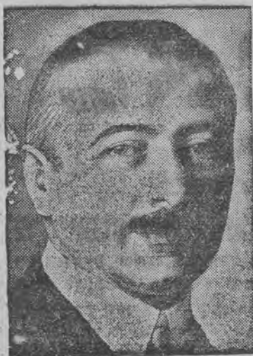
ה' קינב ע. ק. דער גייער פרעזידענט פון דער עסטרייכישער נאציאנאל-באנק

אפצושאפען די אונטערוואסער-שיפען, אפזאגען זיך פון אגאז-מלחמה און סקאסירען די טאנקען קאנצלער ברינינג פארדערט אגלייכע ענטוואפנונג פאר ארע פעלקער