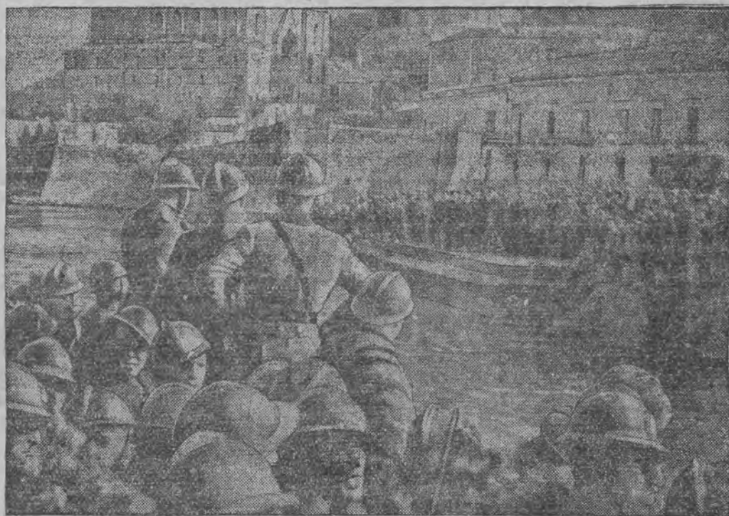
איטאליעניש מיליטער פאהרט אפ קיין שאנכאי, כדי צו שיעען דארט די איטאליענישע אינטערעסען

שאנכאי, 9 (ספ. טעל.) ציליב דעם שטארקען בעשיטען דעם פאקט וואס-סונג דורך יאפאנער, איז אין פאקט פארגעקומען אן אויפרייס, מען רעכענט, אז עס איז פארגעקומען אן אויפרייס אין אמאניציע-סהל'אד.