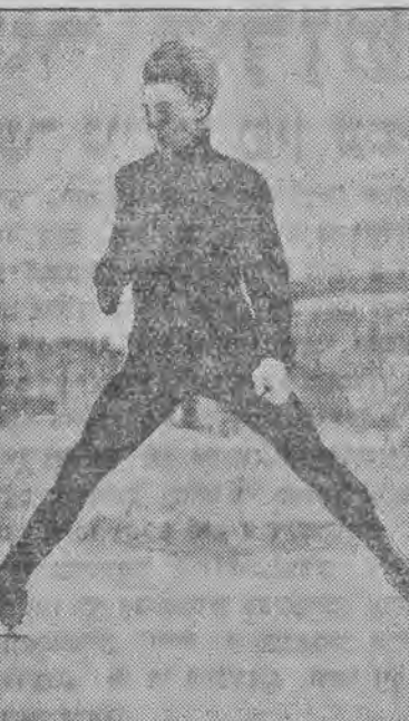
קארל שקסער פון וויטן האט געוואונען די מייסטערשאפט פון קונסטלישען אויפן אייז, אויף דער ווינטער-אלימפיאדע