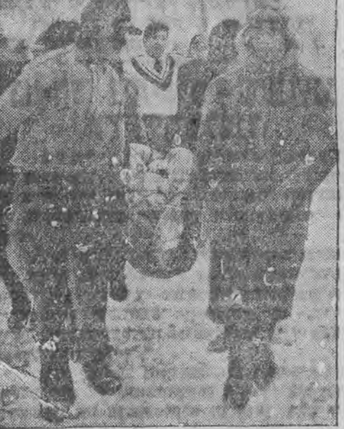
וואָס האָט געטרעפּען די דייטשע שליסען-פּאַהרער אויף דער ווינטער-אלימפיאדע אין סמערקע.