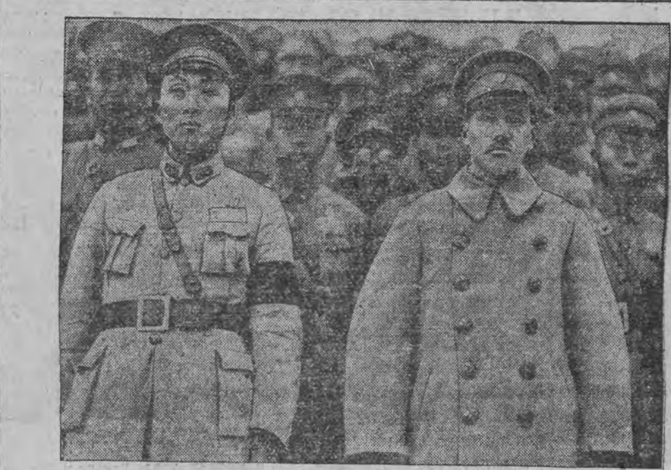
דער געוועזענער פּרעזידענט פון כינע, פּאַרשאַל טשאַנג קאי שיק רעכטס האָט זיך געשטעלט אין דער שפיץ פון כינעזישען מיליטער אין קאמף געגען יאַפּאָן.

האָט דעצידירט צו דערהאַלטען איהר פּאַדערונג. ס'זאל צוזאַמענגעריפען ווערען אַ פערזאמלונג פון דעם פעלקער-בונד וועגען דעם ענין יאַפּאָן-כינאַ. מחמת דעם ענין, וועט דער פעלקער-בונד-ראַט