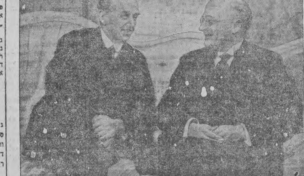
לינקס - דער פּאָרוואַר פון דער קאַנפּערענץ הענדערוסאָ, רעכטס - דייטשער קענצלער ברינגנ.

צוריה געשפונט די אָרם- אינסטיטוציעס אין פּריסק פּריסק (י"א) 14 (י"א) פּערהאַנדלונג גען אין געקומען צו א הסכם צווישען דעם פּער-סאנאל פון היגען, אָרם' מיט דעם נייצם אויסגע-וועהלען קאָמיטעט בונדע צודיק-עפּענען די אנטשאלטען פון אָרם, וועלכע זענען געווען רען געשלאסען אָפּפאַנג היינטיגען חודש. אין צוזאַמענהאַנג מיט דעם איז ראָנערשטאָנג דעם 12-טען ה. ה. געגייט געוואָרען די פּעסי, קייט פון אלע אָפּפּיילונגען פון היגען אָרם.