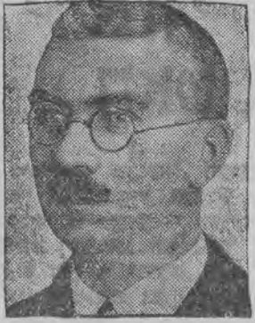
דער לאנד-דירעקטאר פון קליינערע שרי גא, וועלכען די ליטווינער האבען מיט געוואלט בעזייטיגט פון זיין אהט.

קיינער קיינער קיינער זיך נישט וועגען איהר. קיין שום אינדוסטריעס זענען דארטען נישטא, און דער פארט, דער בעריהמטער האפען, וועלכער פלעגט צאמאל זיין פול מיט שיפען און מיט לעבען, איז טויט. מיט אדעס גיט מען זיך נישט אָ. מאַדענע געפיהלען רופט דאָס אַליין אַרײַם בײַ אײַך אײַן האַרצײן. פון אײַן זײַט האָט אײַהר אַ רח מױת אײַך אַרעס; נעבען אײַבערגעלאָזען געװאָרען דען אײַך פּהק! פון דער אַנדער זײַט אַבער, פײַהלט אײַהר אַז גראַד דערפאַר װאָס אַדעס איז אַזױ שטאַרק אָפּגעװנדערט פון דער אײַבערגער רוסלאַנד, איז דאָס לעבען דאָרט פיל מענשליכער, אײַנספאַכער, נאַטירליכער און אױנגעװעמער. מענשען זענען דאָ נישט געװאָהנטען נאַכצואַטאַנען דעם אַלגעמײַנעם װײַלדען טאַנץ פון אײַלענדיש און אײַמער, פּעט, פּאָן, דערײַגען און אײַבערגעײַגען. די שטאַט איז טאַקע פיל אַרײַמער, און זעהט אױס עלענדער װי פיל אַנדערע שטעט אײַן רוסלאַנד; דערפאַר אַבער איז דאָ פיל רױהיגער און געמײַליכער װי אַנדערשװאַר.