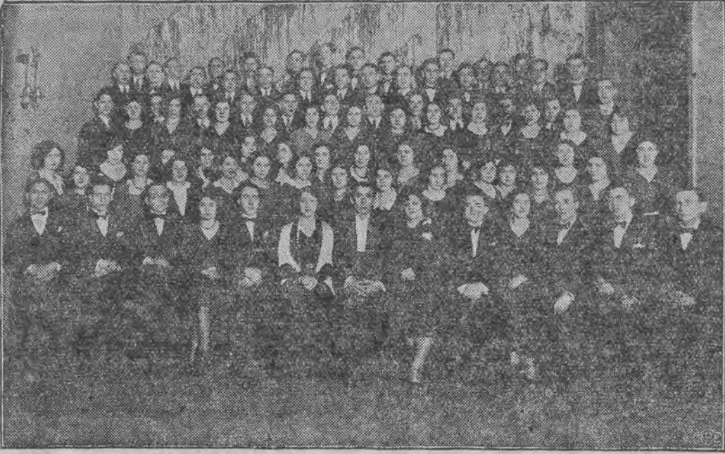
דער "שיר-כאר" (פונדאטארען פון פארשונג - פראפ. י. פיינוויש) וועלכער האט זיך סאמבליירט אין לאדז און מיט זיינע איינפליסער און פילאדאפאגאגאזען האט ער זיך ארויסגעוויזען פאר'ן בעסטען סינסטלערישען כאר אין לאדז און אפשר אין גאנץ פוילען.

אלעמען זענען בעקאנט די זייערן אויפגעבען און טעטיקייט פונ'ם יודישען וויסענשאפטליכען אינסטיטוט. ריווע ארבייט, געזעלשאפטל. בעדייטונג און וויסענשאפטליכע ווערט פון דער דאזיגער אומגעווענער וויסענשאפטליכער פאר דער וויסער קולטור. אום בערלינערן קומט לעצטענס אויס דעם "יווא" צו קעמפן מיט געוואלטיגע מאטעריעלע שוועריקייטן, וואס מאכען ממש אומגעליך סיי די וויסערדיגע וויסענשאפטליכע ארבייט, און סיי דאס פערזענדיגען דעם אגעוועהענעם בוי פון אונזערעם בנין. די לאדזער געזעלשאפט פריינד פון "יווא" האט דער'בער אגעוועהענען א הילף-אקציע לטובת דעם "יווא", וועלכע איז איינע פון די הערליכסטע דערפערדיגע פונ'ם מאהערנעם יודענטום. עס איז צו האפען אז לאדז וועט זיך נישט אפ-זעצן אין מאדאלישער און מאטעריעלער שטיצע, פאר דעם יודישען וויסענשאפטליכען אינסטיטוט.