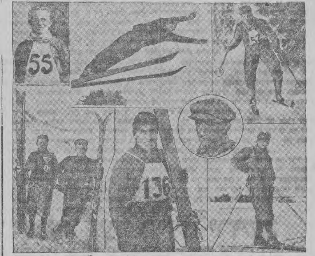
אנטיילנעהמער אין די סקו-מייסטערשאפטען אין שרויבערהאן (דייטשלאנד)