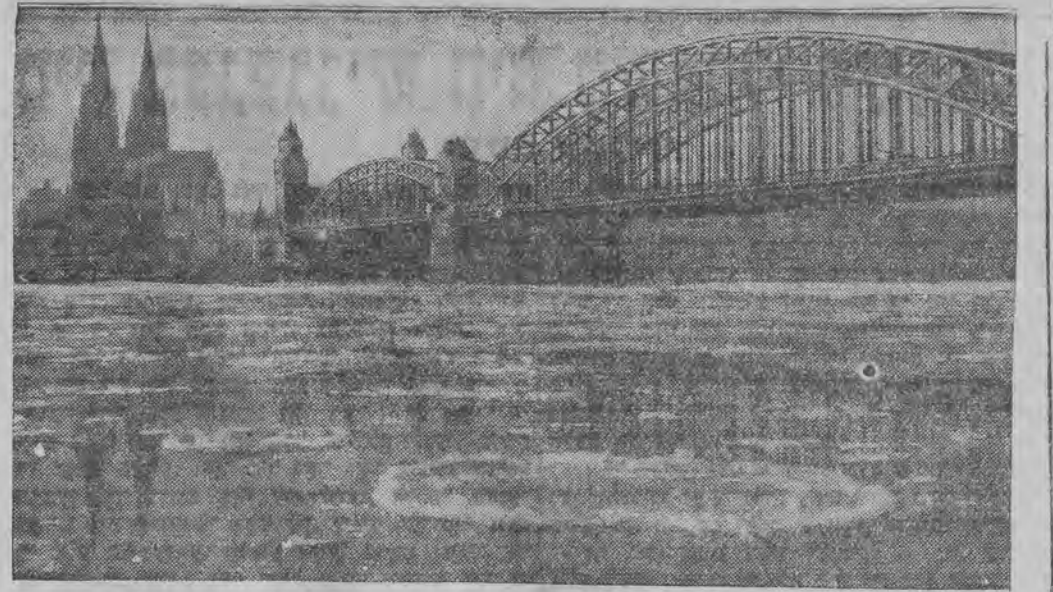
גרויסע אייז-שטיקער בעדעסען דעם רהיין בײַ סען