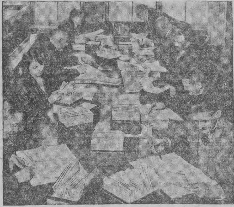
די וועלער-רשימות ווערען צוגעשטעלט לויט די קארטאקעסעס