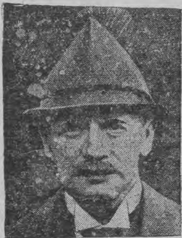
דער געזע. קעניג פון זאַקסען פרידריך אויגוסט דער ציטער איז געשטאַרבען נאָך אַ קורצער קראַנקהייט.

בערלין, 23 (ס.ט.ל.) היינט נאכמיטאָג אין פאַרעקומען די ערעפּענונג פון רייכסטאג אויף אלע גאַסען, וואָס פיהרען צום רייכסטאג זענען גע-שטאַנען גרויסע פּאָליציי-פּאַטרולען, דער פּאַרלאָ-מענטס-בניין איז געווען אַרומגערינגעלט מיט פּאָ-ליציי. דעם פאַרויך האָט געפיהרט פּרעזידענט לעבע. דער ערשטער האָט גענומען אַ וואָרט דער מיניסטער גרענער, וועלכער האָט בעגרינדעט דאָס געזעץ וועגען וועהלען אַ מלוכה-פּרעזידענט. די קאָמוניסטישע דעפּוטאַטען האָבען געוואָלט צו בעדייטיגען די פּאָליציי פון פאַרן פּאַרלאָמענט. דער אַרטיסט פון היטלערסטע געבעלט, האָט אַרטיסטערפּען אַ גרויסען טומעל. דער רעדנער האָט קודם-אל קריטיקירט די אינערליכע פּאָליטיק. און אין דער אויסערן-פּאָליטיק וואָרטער פאַר בריר גיינט רעגירונג אַ שלים-מולדיגע ערלעדיגונג פון די ענטשעריגונגס-פּראָבלעמען. דאָן האָט דער רעדנער אַטאַקירט הינדענבורגען און דאָן זיך גע-זומען צו דער סאַציאַל-דעמאָקראַטישער סאַיאָו ענט-שטאַנען אַ שרעקליכע אוואַנטורע און דער פאַר-זיצער האָט געזאָגט שליסען די זיצונג.