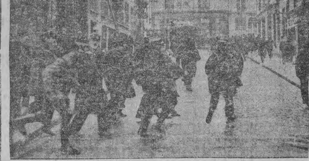
פּאַליציי צוטרייבט סטודענטען דעמאָנסטראַציעס אין צוואַמענהאַנג מיט'ן פּאַלע פון לאוואליס רעגירונג