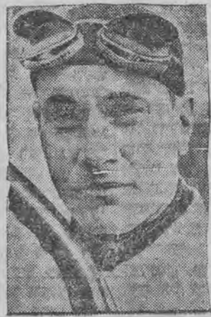
זיגער פון די אויטא-בערג-געיענען אין בראזיליען.

זינקס : שוואמבורג (דייטשלאנד) האט געשלאגן איינס רעקארד אין 8000-מעטער-לויף.