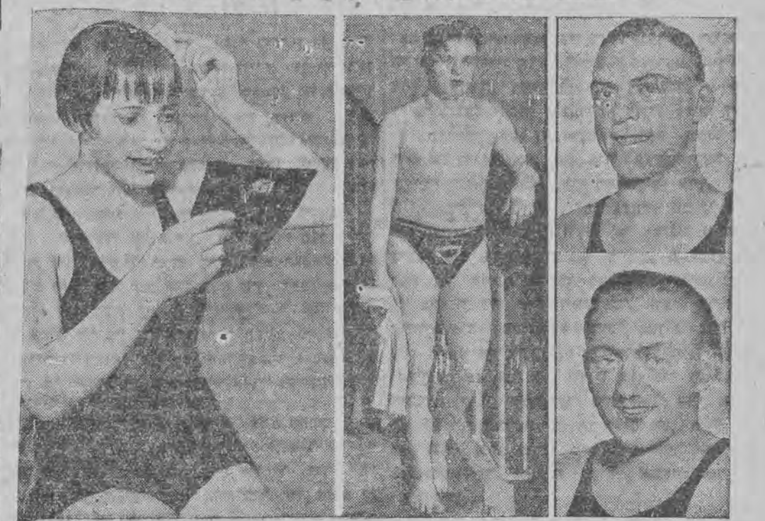
אויבער וועסט: ע. ס. ר. אונטער רעכטס: וויטענבערג, אינדערמיט: ד. י. ט. ל. לינקס: אלגע יארדאן. קונסט-שפרינגען ברונט-שווימען רוקען-שווימען פרויען-קונסט-שפרינגען

ערשטער פוסבאל-מעטש פון היי-עעהריגען סעזאן אין לאדו ווידעו - טוריסמען 0:4 (0:1)