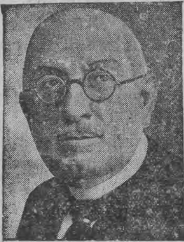
פרעסענדיט אים'ן טראקן פון פאלעסטינא