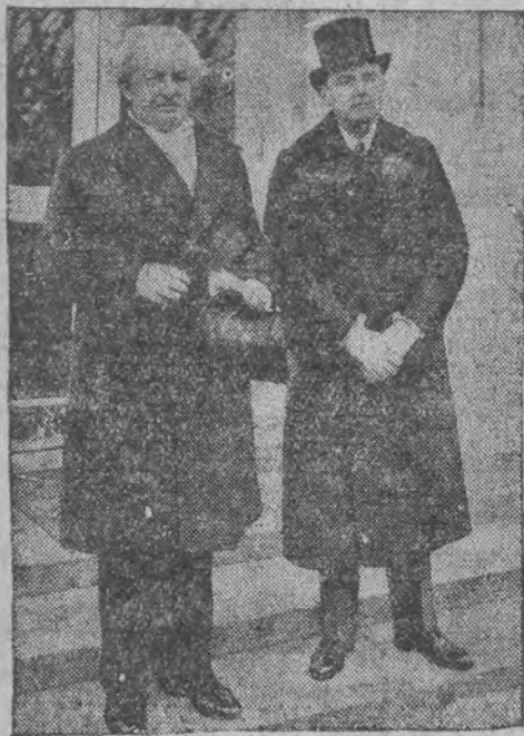
דער דייטער דיכטער געווארען היינטמאן וועלכער געפינט זיך איצט אין צעטיקע, איז אויסגענומען געווארען דורך פראנצויזישע הויכער.

פון דעם שלום-שליסונג האבען דריי ענגלישע מלוכה-מענער געארבייט איבער דער אפשוואכונג פון די ענגליש-פראנצויזישע בעציהונגען: לאיד דזשארדזש, לארד ד'אבערבאן און מאנטאגני נאָרמאָן אונטער זייער וויקונג האָט די רעגירונג פון דער לייבאר-פארטיי און די באַנקירען, געשטעלט אַ קאָרט געגען פראַנקרייך — דער ווייזער פון דייטשלאַנד אין איהר אַנאַליגען רוהם און עשירות — די פראנצויזען — האָט דער פראנצויזישער קלערט — דארפן דעריבער אַנווענדן אַלע בע- מיהונגען, און נישט אויסמירען יעדע מיטעל, כדי אויסצו-יאַנגוויפן דעם ענגען קאָנטאַקט, ווי ס'איז געווען צו-אָנעלע און בענייען די פראַנצויזישע, וואָס איז דאָס זיך די איינציגע נאראטיע פון אַרדענונג און פירדען אין איראפע.