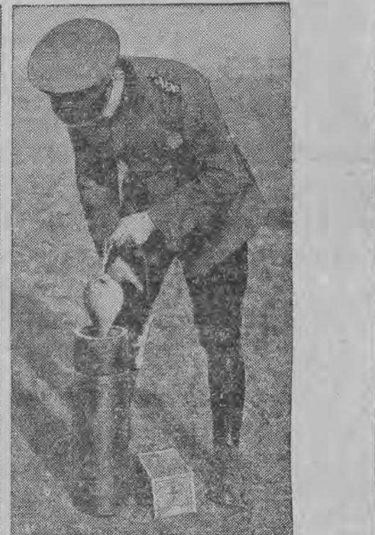
אין דער לעצטער צייט האָט עסליכע מאל פאַרטר, און אויסלענדישע מיליטער- אפּראָפּאָגאַנדע זענען אַרביבערעפלונגען די דייטשע גרעניץ. סענענדיג, און זיי האָבען זיך פּערפאַנדזשעט. די דייטשע גרעניץ-פּאָליציי האָט צוויי דעם אייגע- מיהרט ווי-גאַמבעט, וועלכע זאָגען אַן דעם פליהער, און ער איז אַריבער אויף א פּרעמדע טעריטאָריע.