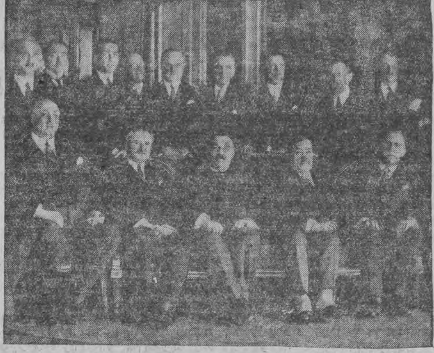
אין צוזאמענהאנג מיט די אונטערהאנדלונגען ווענען א דוגא-פערזאציע.