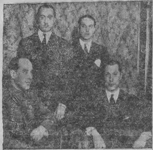
די זיין פון געוועזענע שפאנישע זינגער-פאר פרימא דע ריווערא שטעהן איצט פאר א קריגס-געריכט פאר בעליידיגען עפענטליך די רעפובליק.

צו דער מכבי'אדע און מורחירידי אין תל-אביב, דער זארגעבער, "מכבי" וועט צו. אגד. אויף דער מכבי'אדע אויספיהרען יוגאסלאווישע טעגן אין נא- ציגאל-קאסטימען.