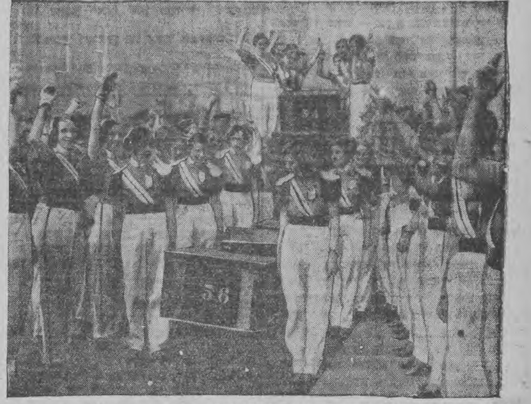
די ציהונג פון דער אירלענדישער לאַטעריע. יונגע מיידלעך מאַרנען די קעסטלעך מיט די לאַטען