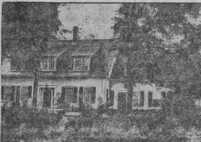
רעכטס: דער שלאס, צוליב וועלכען קובעליה האט באנקראטירט.

די גרויזאמע געשעהענישען האבען געמאכט א שטארקען רושם אויף דער ארטיגער בעפעלקע- רונג, די נאציאנאל-סאציאליסטישע פרעסע פרובט אויסצוצען דעם פאל פאר א שענדליכער ריטואל- מארד-העצע און בעמיהט זיך ארויסצוהאפען האס- שטימונגען צווישען דער בעפעלקערונג פון פארע- בארן געגען די יודישע מיטפירער.