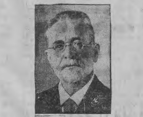
בעריהמטער שפראכען-פארשער סיווערס איז געשטארבען אין עלטער פון 81 יאהר

ער האט פראקלאמירט א גרויסע געלד-זאמ- לונג-אקציע פון דער "אגודה" לטובת א"י. עס וועט געשאפען ווערען א ספעציעלער פאנד, און די "אגודה" גרייט זיך אויך צו ארגא- נזירען אנאקציע פון שיקען יודען קיין א"י. צו דער רעדע פון ר' אימישע מאיר לעוויז, (מ'האלט, אז ער האט גערעדט אין נאמען פון גערער רבי'ן) גיט מען צו א וויכטיגע בעדייטונג, און מ'האלט עס פאר אנאיבערברונג, אין דער פא- ליטיק פון די "אגודה"-קרייזען ובפרט פון דעם גערער הויף לגבי ארץ-ישראל.