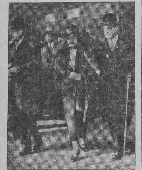
רייזע פון בערלינער באטשאפטער פון די פאראיי-ניגטע שטאטען קיין פאריז, די רייזע שטעהט אין צוזאמענהאנג מיט דער פארשטענדער לעזונג פון דער ענטשעדיגונגס-פראגע.

דער אפגעבארונגס-אידן ווערט אפגעבען אויף א זיצונג פון געריכט, דער באנקראטירטער הויבט אויף צוויי פינגער און זאגט נאך דעם ריכטער איך שווער!