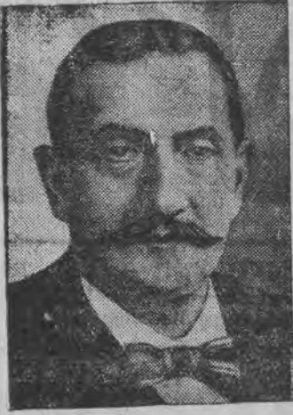
50-יאהריגער יובילעאום פון ווארען-הויז סיי, דער גרינדער פון ווארען-הויז הערמאן סיי.

מיט די אויבענדערמאנטע געשפערעכען, דער פערמיטלער צווישן סטאלין און טראצקי'ן איז דער לייטער פון דער ג. פ. א. א. אנשטור אין קאנטאקטן אפאל. ער זאל זיין האבען געהאט עטליכע גע- שפערעכען מיט טראצקי'ן אויף דעם אינוועל פרינ- קיפא וואו טראצקי וואוינט שטענדיג. דער טרוקישער רעגירונג - רעכענט מען - איז אפיציעל מיטגעטיילט געווארען וועגען די דאזיגע געשפערעכען.