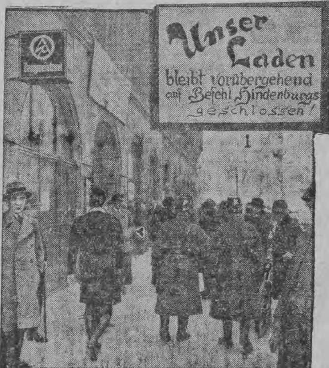
פאליציי שליסט א מאנאזין פון די היטלעראוועס