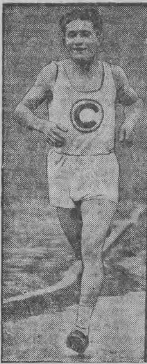
האָט נעכטען געוואונען דעם וואלד-לויף אין סטוטגארט.