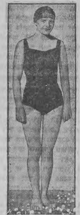
האָט געמאכט נייע וועלט רעקארדען אין שווימען.