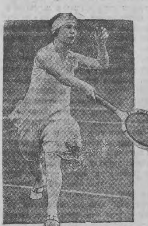
נייער טעניס-שטערן אין דייטשלאנד.

פון פרעזעס וואָלף און קאָפיטאָו אינזש. פּויקס זענען די אַנטוויקלונגעמער ארויסגעפאָרען אויף אַנאָמיס-פּלוג קיין לאָוויטש.