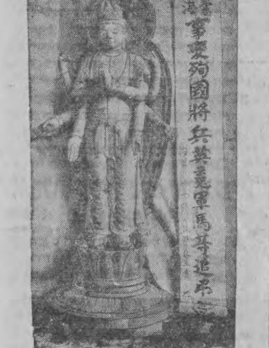
דעם יאפאנישער דענקמאל פאר די געפאלענע זעלנער