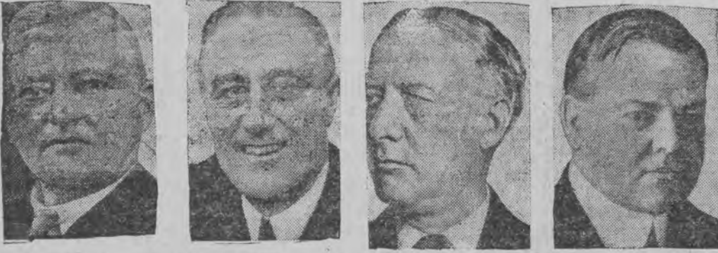
הובער (רעפובליקאנער פארטיי) אל סמיט (דעמאקראטען) פראנקלין רוזוועלט (רעפובליקאנער) גארנער (דעמאקראטען)

די האנדיאטעז אויף פרעזידענט פון די פעראייניגטע שטאטעז