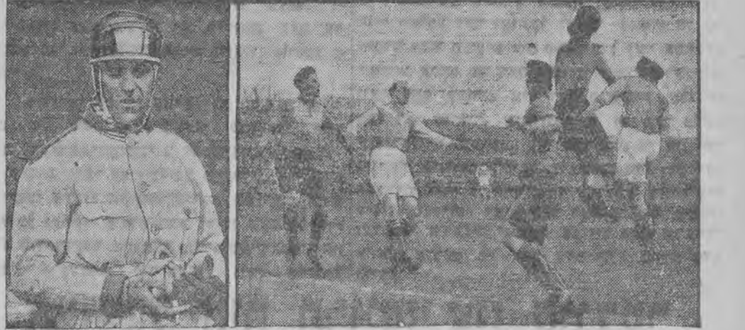
לינסק: דער איטאליענער נאוואלארי האט געשלאגען רעקארד אין אויטא-געיענען רעכט: מייסטערשאפט-מאגן אין בערלין.