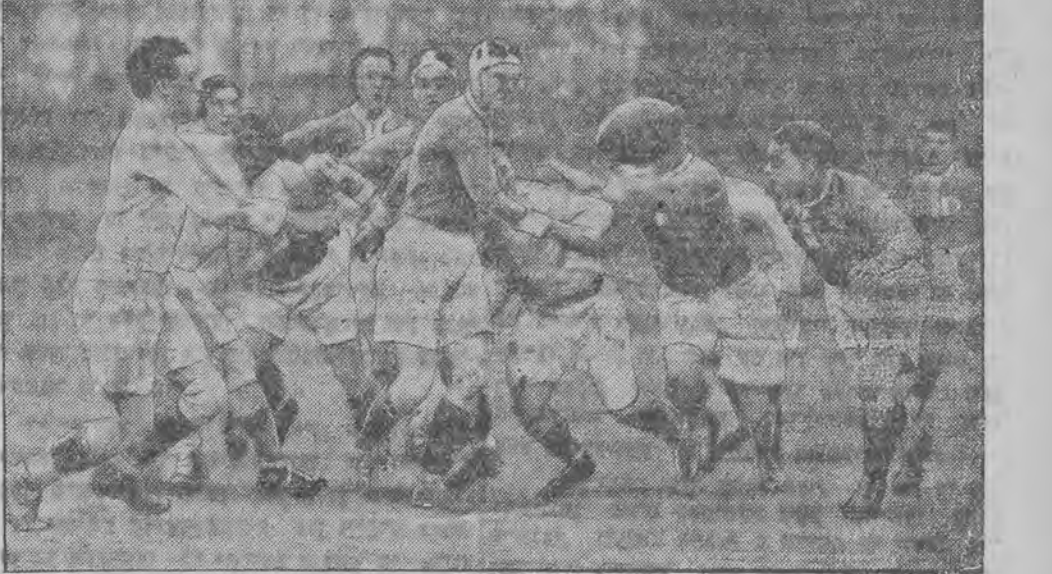
רנבי-גאספא פראנקרייך - דיימלאנד האט זיך פערנריגט מיט א זיג פון פראנקרייך