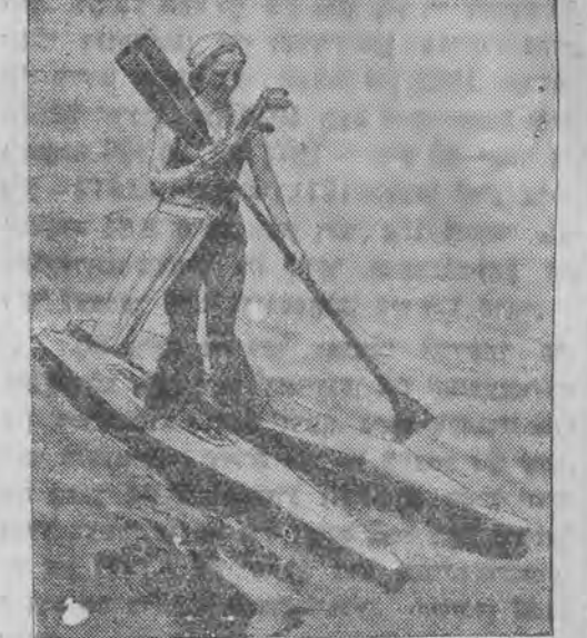
דער נייער ספארט פון וואסער-סקי.