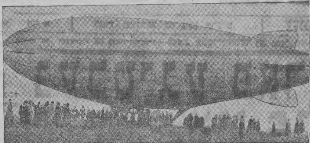
וואס איז אויסגעבויט געווארען אין סאוועט-רוסלאנד