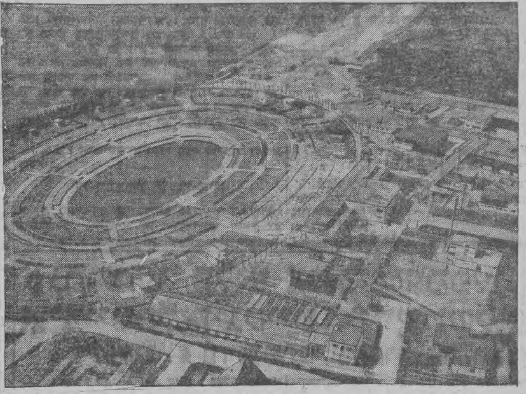
אויסשטעלונג אין בערלין