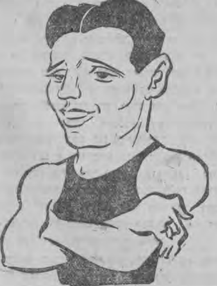
האט געשלאגען א נייעם וועלט-רעקארד אין 200-מאטער ברוסט-שווימען.

לען וועגען דעם - מיר זענען געפארהען 3 שווער-אטלעטען מיטן, שטערן און ווינגארטען, צועלכע אטלעטען וואס זייערע לייטונגען דערגעהען צום וועלט-רעקארד, ווען דער וועלט-רעקארד אין ווינגארטענס וואג בעטרעפט 280 קילא. האט ווינגארטען גאנץ לייכט געמאכט 267 קילא. מיר האבען דעריבער גע-רעכענט, אז מען וועט אונז בעטראכטען אזוי ווי אונזער בעשיידענער ווערט איז, צום סוף איז גע-קומען די ענטווישונג, מיר זענען אינגאנצען אויף דער מכה'דיגע נישט אויפגעטרעטען פארוואס? - ס'איז לעכערליך צו זאגען, אבער נאך דערפאר וואס די לייטונג האט קיין שטאנג צו הויבען נישט געהאט צוגעגרייט. דער לייטער פון דער עגיפטישער עקספעדיציע האט געוואלט ברענגען א פארשריפטליכע שטאנג פון עגיפטען, די פוילישע שו לייטונג האט דאס אבער גרינגעשעצט און אזוי איז אוועק די צייט און אונזערע פונקטען, וועלכע מיר וואלטען זיך געוואונען זענען נישט צוגעפיר-כענט געווארען צו אונזערע לייטונגען, דאס איז נישט אלץ, מ'האט זיך בכלל אויף אונז נישט אומגעקוקט, הגם איינער פון אונזערע אטלעטען איז אויפ'ן וועג קראנק געווען, קיין איין עקספעדי-ציע איז נישט אזוי שלעכט ארגאניזירט געווען ווי די פוילישע. - איז דאס אייער פעסטער בעשעלט האבען מיר געשטעלט די לעצטע פראגע - ליידער, נאך אנדערש וועט שוין נישט ווערען.