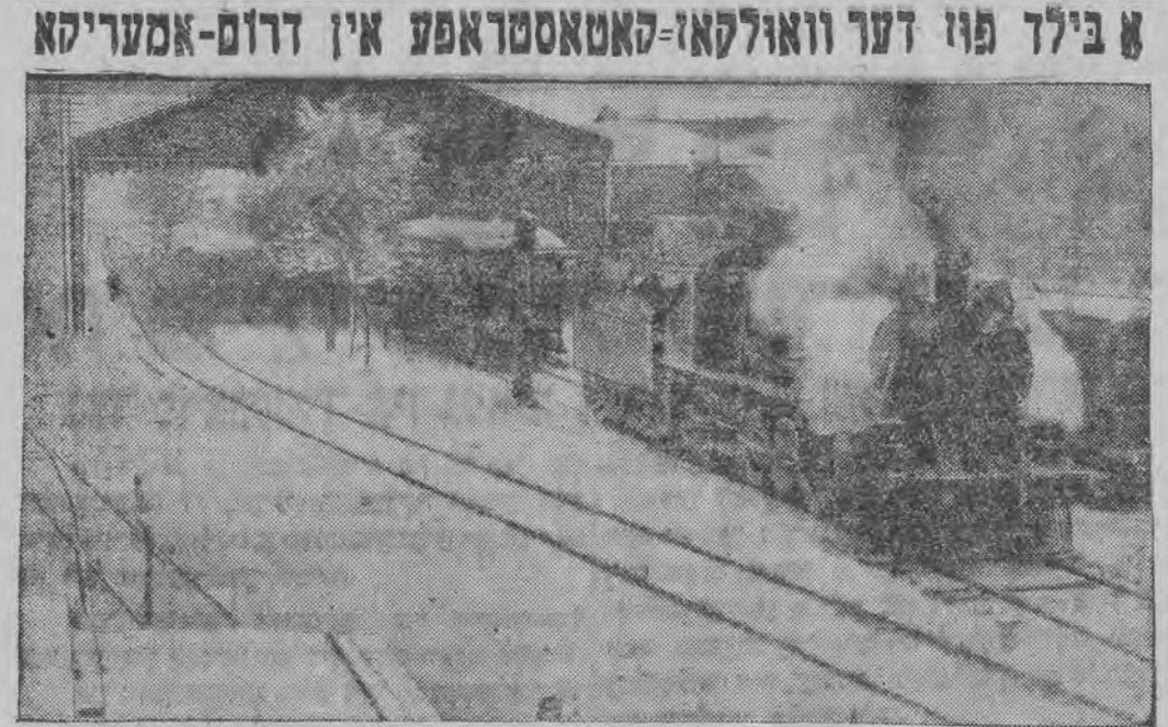
דער וואקאל פון קוריקא אין משירי

די „רעפובליק פערזיכערט אבער, אין אן א- נער, דער ענגלישער הענג און די העניגין ביי א נייעם ריזיגען פראזשעקטאר פון דער ענגלישער ארמע