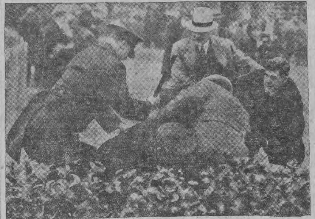
קאפּא פון פּאַליציי מיט סאַפּאָניסען אויף די נאַסען אין וואַשינגטאָן

אין צוגעפּענעטעלס געוואָרען בײַ אַפּריל 1931, ער-מען צום סאַדערדיגסט אַזויגע ציפּערען: אויף דער גאַנצער טעריטאָריע פון דעם רוסלאַנד פּערבאַנד האָבן זיך צו קענער דאָס געפּענען אַרום 790,000 יודען, וואָס פּערזאָנלעך זיך מיט אַרײַן אַר-בייט, צווישן זיי אין אַקאָרדיע - 284 סײַדע, און ווייט-רײַסלאַנד - 86 סײַדע; אין לענינגראַד דער געגענד - 69 סײַדע; אין צפֿון-קאָוקאַז - 18 סײַדע; אין אַנדערע געגענדער - 100 און 5 האַלב סײַדע; אין קריים - 9 סײַדע.