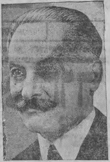
קאנדידאט אויף פלובה-פרעזידענט

פון פעלדער-בונד-ראט אין גענה גענף, 8 (ספ. טעל.) היינט, מאנטאג ווערט געעפנט די סעסיע פון פעלדער-ליגע-ראט. געשלאסען געווארען דער ווירט-שאפטליכער אפמאך צווישען דייטשלאנד און די סאָויעטען בערלין, 8 (ספ. טעל.) עס איז געשלאסען געווארען דער ווירט-שאפטליכער אפמאך צווישען דייטשלאנד און די סאָויעטען.