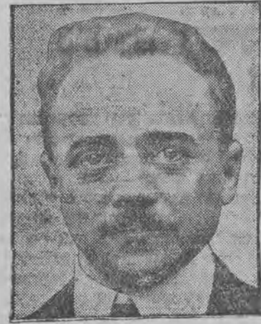
ד"ר רפאל קאנידאס, קאנדידאט אויף פרעמיער