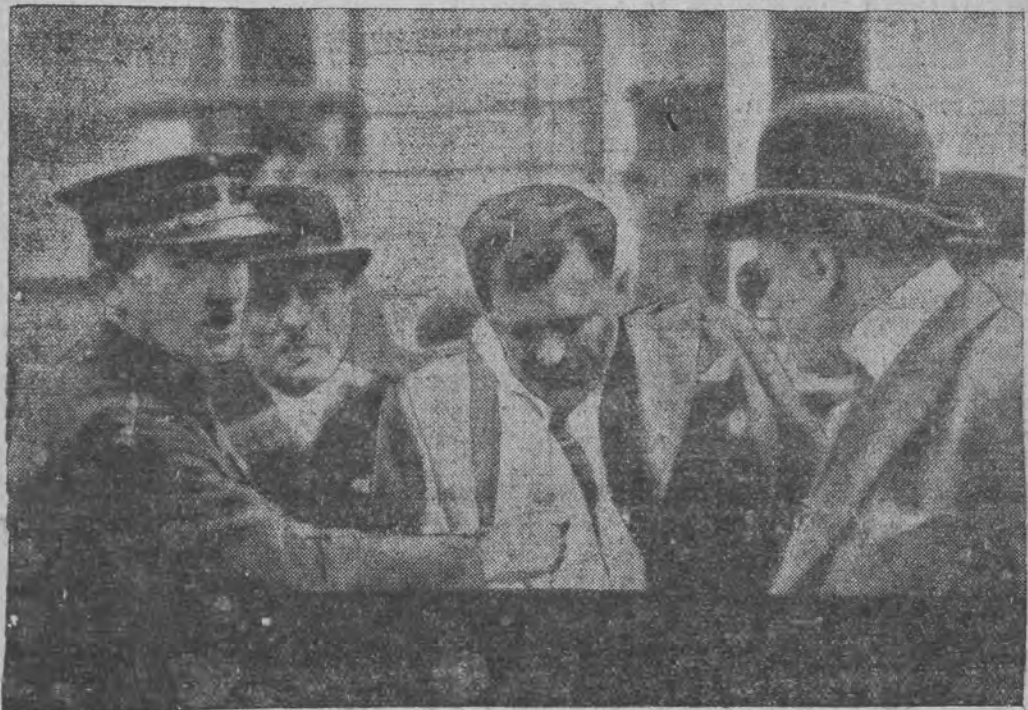
דער אַרעסט פון אַטענטעטער גארגולאוו

ראדיא-פילד פון אטענטאט אויפ'ן פראנצויזישען פרעזידענט