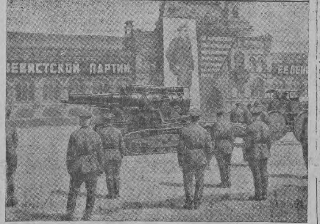
פון מראנט: א שווערער הארמאט, אין הינטערונג - לענינס פארטרעט.

די אונטערטע יודען פויערען איבער א מאד-בעם יום-טוב, עס איז א וויכטיגער יידישער יום-טוב, עס איז א יאהרצייט מיט א יובילעאום איב-איינעם, א יאהרצייט - צוליב דעם, וואס דער אומגליק האט זיך געענדיגט מיט א שמחה.