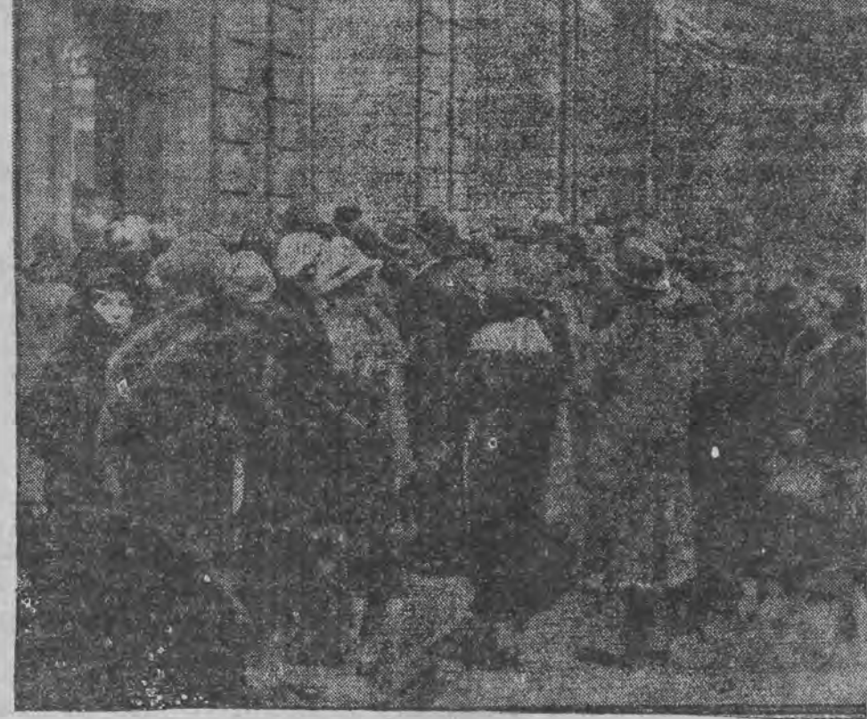
דער ערשטער פּערהער פון מערדער פאַרעל נאַרנולאַוו