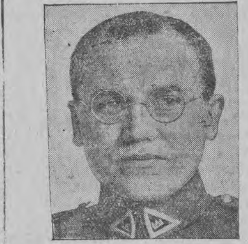
ליטווענער פולקאוויק סקיפרא, זאל בע שטימט ווערען אלס געבורגמאן פון קליינפעדא.

כאראקאוו (י. ט. א.) הונדערטער יודישע ארביי- טער קומען אן קיין כאראקאוו פון פאלטאווע, וואו זיי זענען ביז איצט געווען בעשעפטיגט אין די טריקאטאזש-פאבריקען וועלכע זענען געגרינדעט גע- ווארען ביי דער מיטהילף פון „אויס“ און „אגרא- דוסאינט“, און א דאנק די מאשינען, וואס זענען צוגעשיקט געווארען דורך קרובים און אמעריקע. די יודישע ארבייטער פערלאזען מאסענווייז פאלטאווע צוליב דעם ברויט-מאנגעל, וואס הערשט דארט און פאדערען איבער קיין כאראקאוו, וואו עס איז פערלאזען גענוג שפייטמילען און אויך ארבייט אויב גאנץ לייכט צו בעקומען, צוליב דעם, וואס די ארבייטער פערלאזען מאסענווייז פאלטאווע האבען זיך פיל דארטיגע גרויסע טריקאטאזש-פאבריקען גע- שלאסען, אין די פאלטאווער פאבריקען וואס זענען געווען ארגאניזירט אויף קאאפעראטיווע יסודות, זענען געווען בעשעפטיגט סווענדיג, „לישענעס“ וועלכע האבען אויף ארום בעקומען סאמיעטישע בירגער-רעכט און קענען בעשעפטיגט ווערען אין אלע פאבריקען.