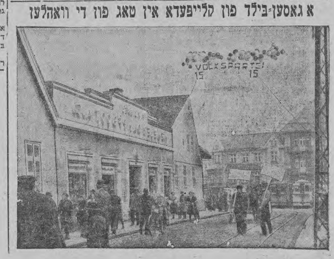
א גאסען-בילד פון קליינפעדא אין טאג פון די וואהלען