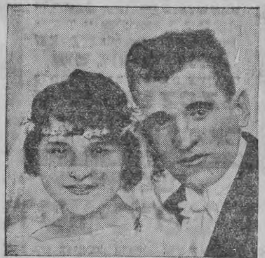
דער פרעזידענט-מערדער גארגולאוו און זיין פרוי

בעלגראד, 11. (ספ. טעל.) די צייטונג „וועמע“ פערפענטליכט א סענסאציעלע מיטטיילונג פון א לאבארענטין פון א בעלגראדער קליניק זאפא קאזשיראדוקא, וועלכע שטעלט-פעסט, אז זי האט זיך בעקענט מיטן מערדער פון פרעזידענט זישען פרעזידענט גארגולאוו, בעה, דער מלחמה, אין ווארשא, לויט זי גיט איבער האט גארגולאוו שטודירט אין ווארשא מעדיצין און איז דארט בע טראכט געווארען אלס הייסער קאמניסט וועלכער האט פראפאגאנדירט די קאמוניסטישע אידעען. ער האט זיך פערליבט אין דער טאכטער פון דעמאלסדיגען פראפעסאר וואלעריאן פאגארעלאוו, מיט וועלכער ער האט אויך חתונה געהאט שפעטער. ווען די דייטשען האבען פערנומען ווארשא, איז די ווארשאווער אוניווערסיטעט איבערגעטרעגען געווארען קיין ראסטאוו-דאן. אין יאָהר 1923 האט קאזשיראדוקא זיך בע געגענט מיטן פראפעסאר פאגארעלאוו, וועלכער האט איהר ערקלערט, אז זיין טאכטער האט זיך גע גט מיט איהר מאן. נאָכ'ן גט האט גארגולאוו פער-בראכט אין סאָויעטען-רוסלאנד און איז שפעטער אָפגעפאָהרען קיין איטלאנד.